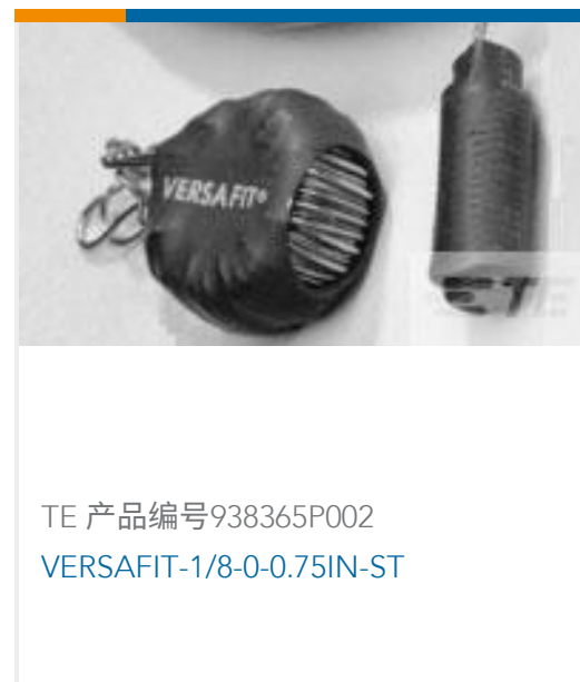
TE 产品编号938365P002 VERSAFIT-1/8-0-0.75IN-ST