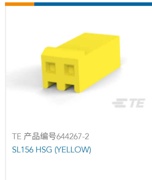
TE 产品编号644267-2 SL156 HSG (YELLOW)