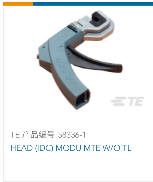
TE 产品编号 58336-1 HEAD (IDC) MODU MTE W/O TL