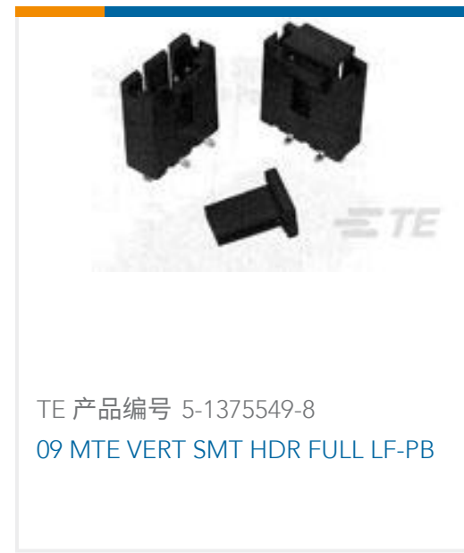
TE 产品编号 5-1375549-8 09 MTE VERT SMT HDR FULL LF-PB