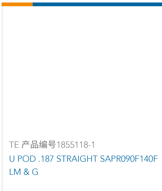
TE 产品编号1855118-1 U POD .187 STRAIGHT SAPR090F140F LM & G