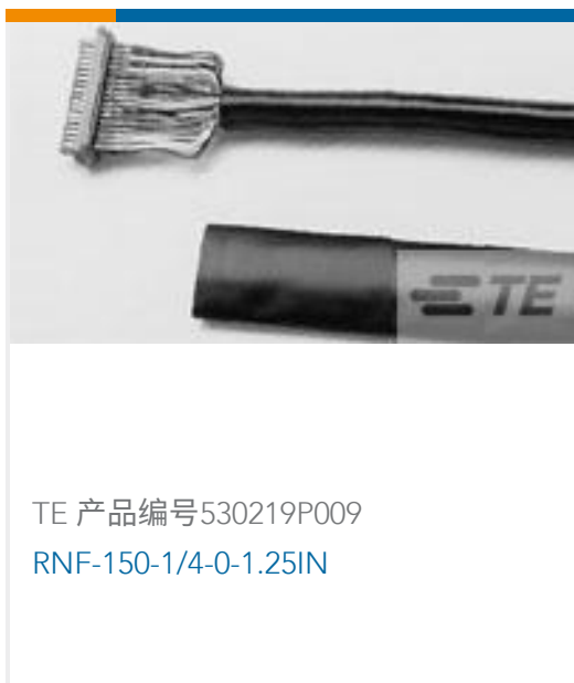
TE 产品编号530219P009 RNF-150-1/4-0-1.25IN