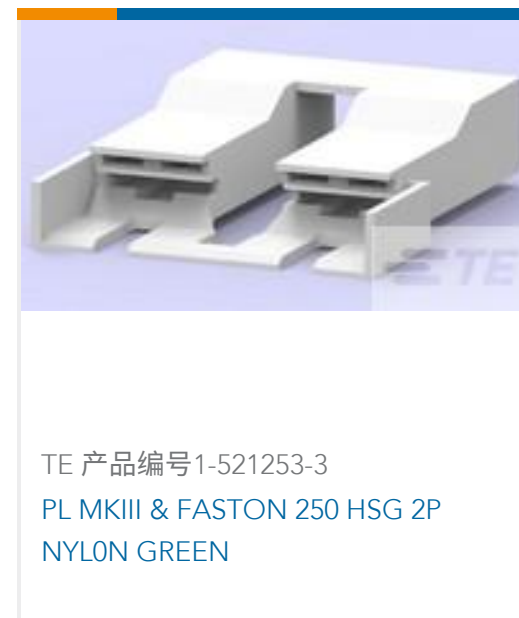
TE 产品编号1-521253-3 PL MKIII & FASTON 250 HSG 2P NYLON GREEN