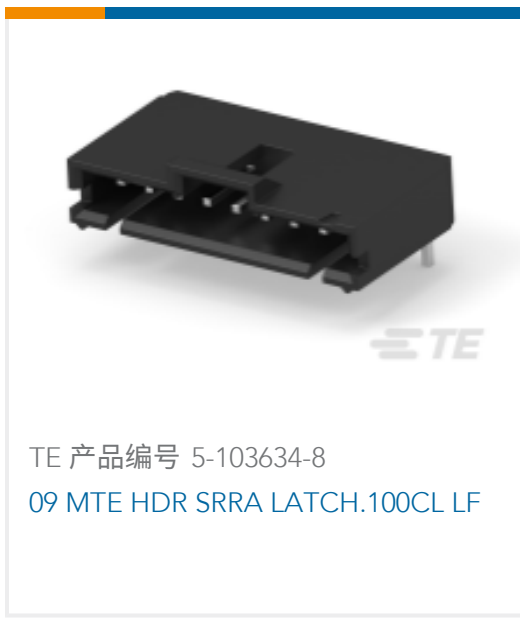
TE 产品编号 5-103634-8 09 MTE HDR SRRA LATCH.100CL LF