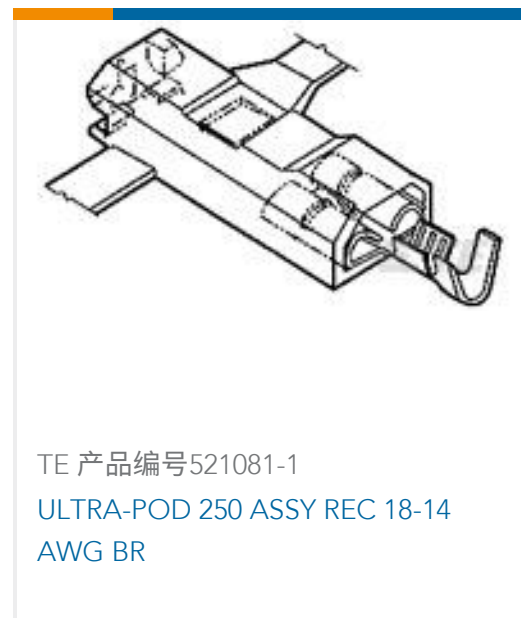
TE 产品编号521081-1 ULTRA-POD 250 ASSY REC 18-14 AWG BR