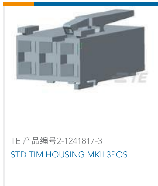
TE 产品编号2-1241817-3 STD TIM HOUSING MKII 3POS