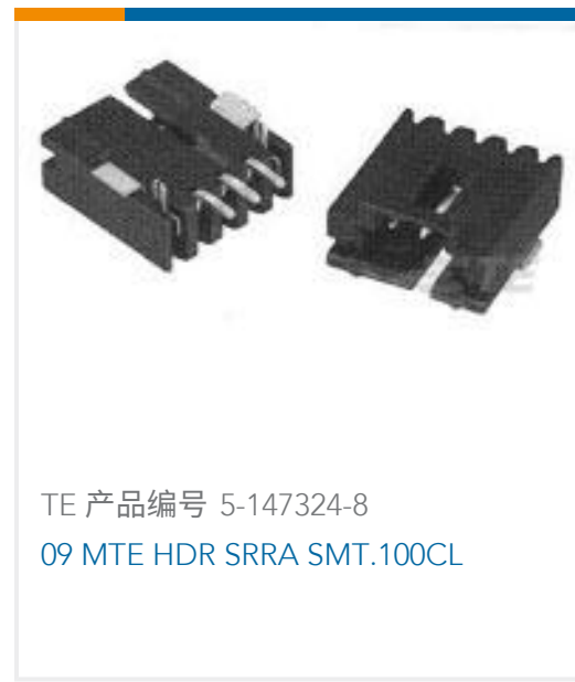
TE 产品编号 5-147324-8 09 MTE HDR SRRA SMT.100CL