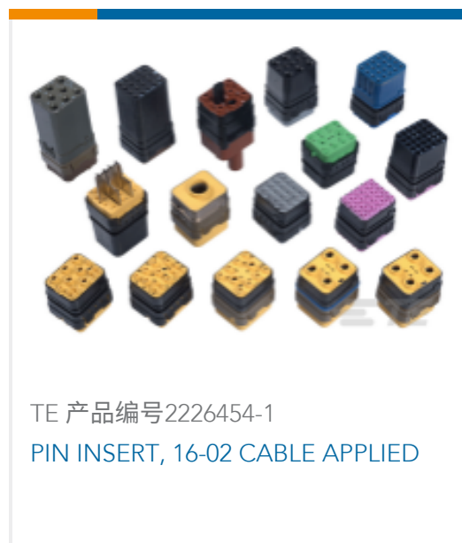
TE 产品编号2226454-1 PIN INSERT, 16-02 CABLE APPLIED