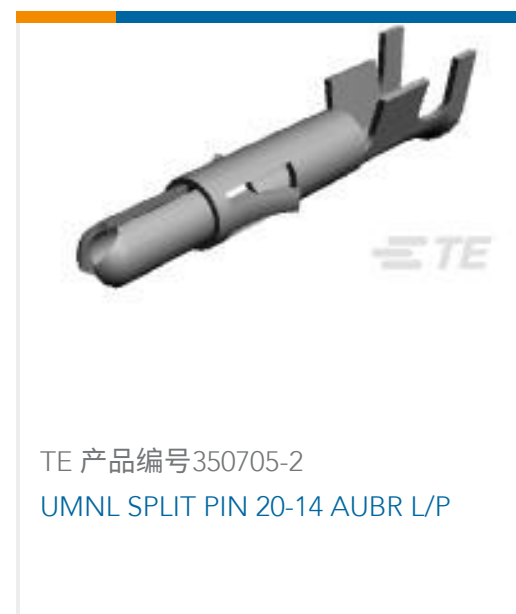
TE 产品编号350705-2 UMNL SPLIT PIN 20-14 AUBR L/P