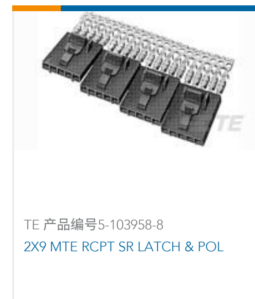
TE 产品编号5-103958-8 2X9 MTE RCPT SR LATCH & POL