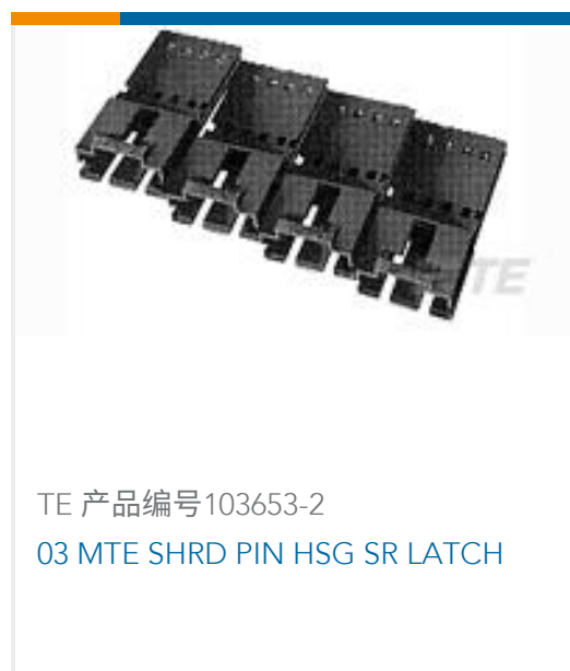
TE 产品编号103653-2 03 MTE SHRD PIN HSG SR LATCH