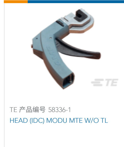
TE 产品编号 58336-1 HEAD (IDC) MODU MTE W/O TL