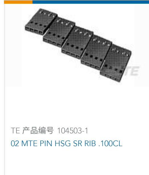
TE 产品编号 104503-1 02 MTE PIN HSG SR RIB .100CL