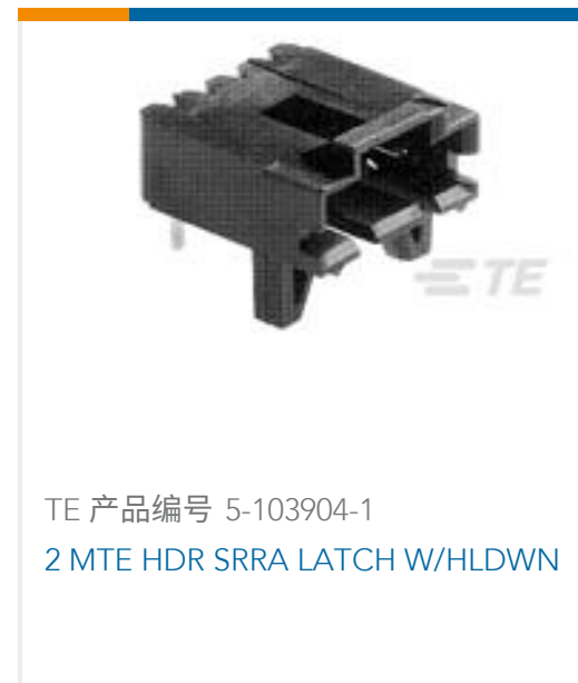
TE 产品编号 5-103904-1 2 MTE HDR SRRA LATCH W/HLDWN