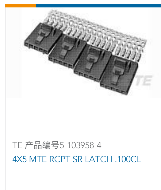
TE 产品编号5-103958-4 4X5 MTE RCPT SR LATCH .100CL