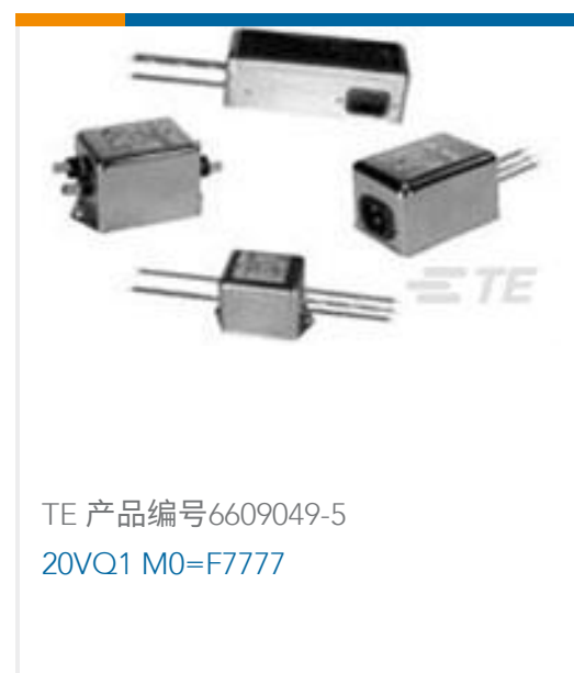
TE 产品编号6609049-5 20VQ1 M0=F7777