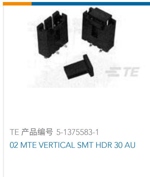
TE 产品编号 5-1375583-1 02 MTE VERTICAL SMT HDR 30 AU