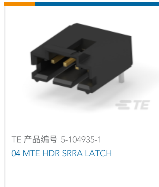
TE 产品编号 5-104935-1 04 MTE HDR SRRA LATCH