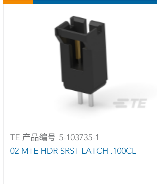
TE 产品编号 5-103735-1 02 MTE HDR SRST LATCH .100CL