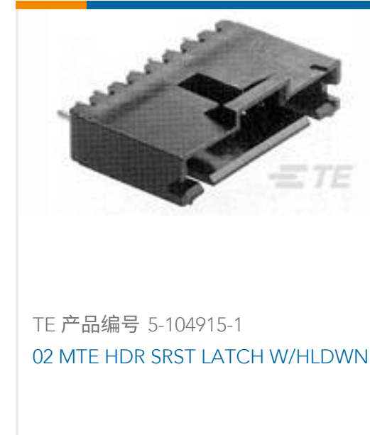
TE 产品编号 5-104915-1 02 MTE HDR SRST LATCH W/HLDWN