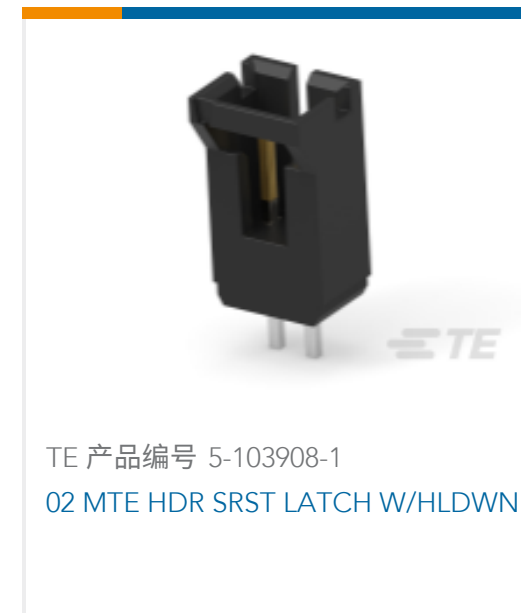
TE 产品编号 5-103908-1 02 MTE HDR SRST LATCH W/HLDWN