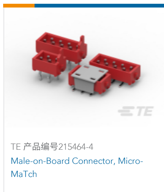
TE 产品编号215464-4 Male-on-Board Connector, Micro-MaTch