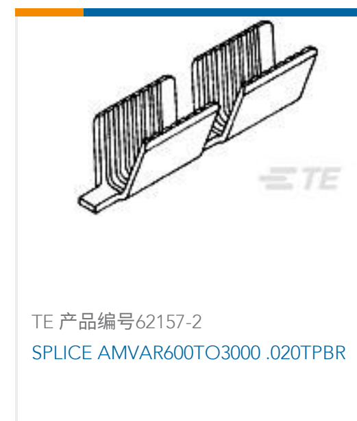
TE 产品编号62157-2 SPLICE AMVAR600TO3000 .020TPBR