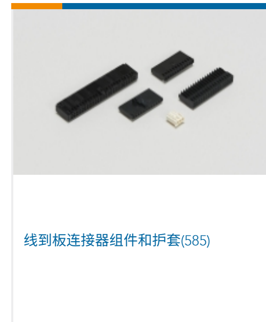
线到板连接器组件和护套(585)