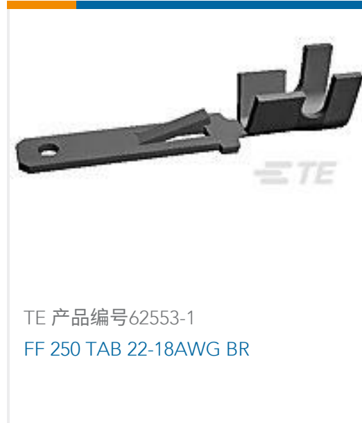
TE 产品编号62553-1 FF 250 TAB 22-18AWG BR