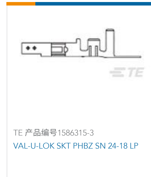
TE 产品编号1586315-3 VAL-U-LOK SKT PHBZ SN 24-18 LP