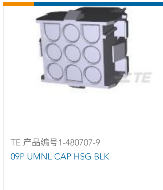
TE 产品编号1-480707-9 09P UMNL CAP HSG BLK