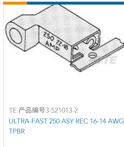
TE 产品编号3-521013-2 ULTRA-FAST 250 ASY REC 16-14 AWG TPBR