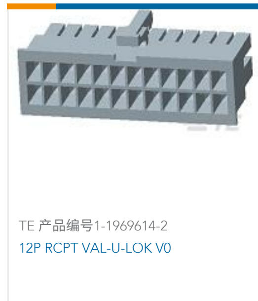
TE 产品编号1-1969614-2 12P RCPT VAL-U-LOK V0