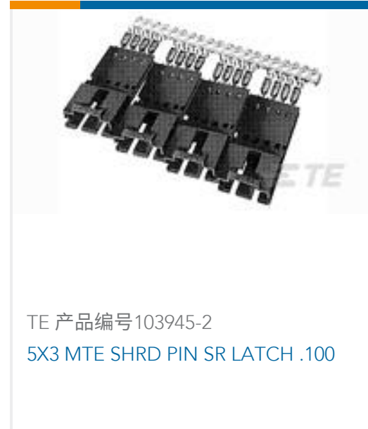
TE 产品编号103945-2 5X3 MTE SHRD PIN SR LATCH .100