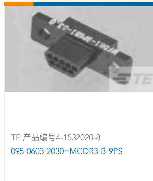
TE 产品编号4-1532020-8 095-0603-2030=MCDR3-B-9PS