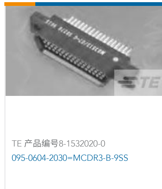
TE 产品编号8-1532020-0 095-0604-2030=MCDR3-B-9SS