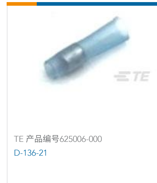
TE 产品编号625006-000 D-136-21