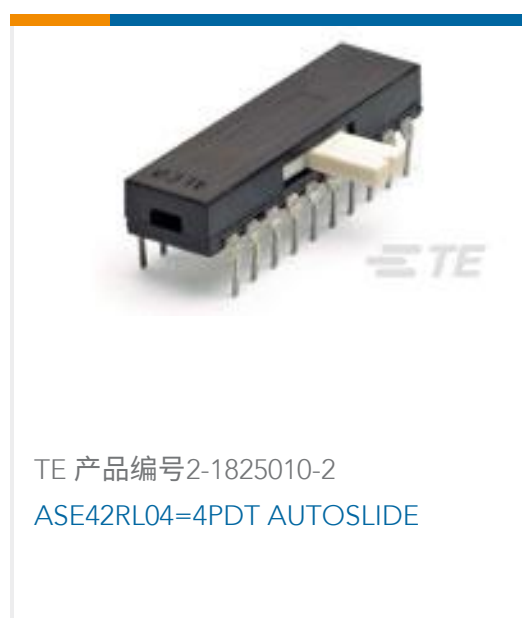
TE 产品编号2-1825010-2 ASE42RL04=4PDT AUTOSLIDE