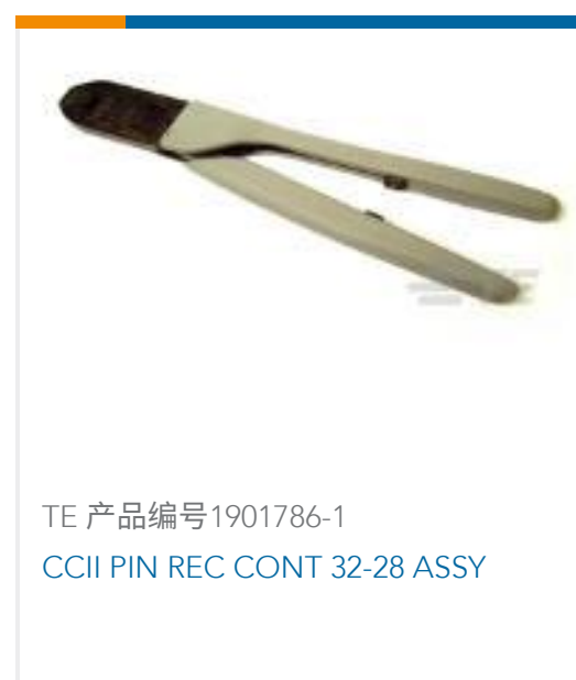
TE 产品编号1901786-1 CCII PIN REC CONT 32-28 ASSY