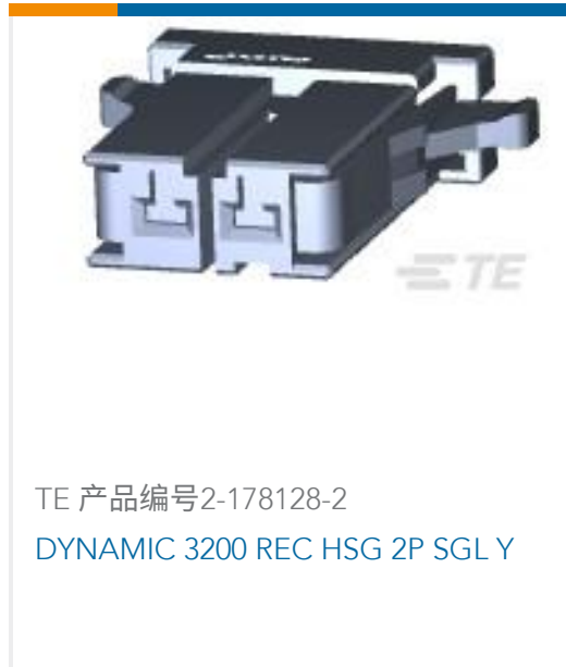
TE 产品编号2-178128-2 DYNAMIC 3200 REC HSG 2P SGL Y