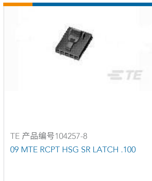
TE 产品编号104257-8 09 MTE RCPT HSG SR LATCH .100