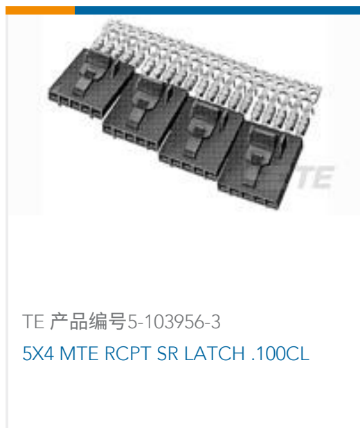
TE 产品编号5-103956-3 5X4 MTE RCPT SR LATCH .100CL