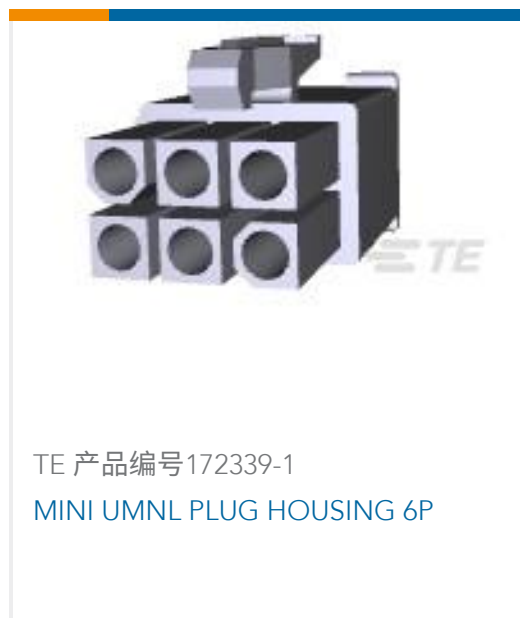
TE 产品编号172339-1 MINI UMNL PLUG HOUSING 6P