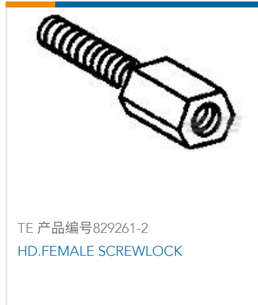
TE 产品编号829261-2 HD.FEMALE SCREWLOCK