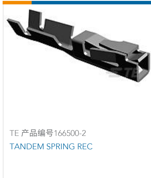
TE 产品编号166500-2 TANDEM SPRING REC