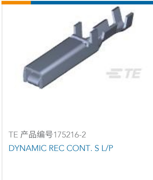
TE 产品编号175216-2 DYNAMIC REC CONT. S L/P