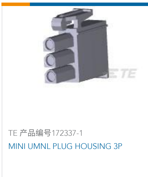
TE 产品编号172337-1 MINI UMNL PLUG HOUSING 3P