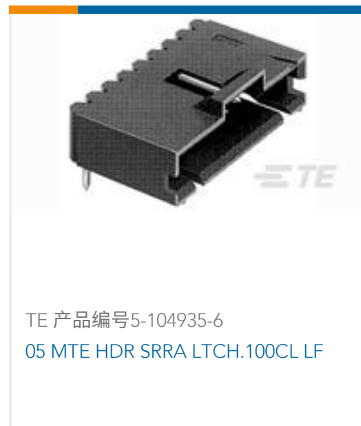
TE 产品编号5-104935-6 05 MTE HDR SRRA LTCH.100CL LF