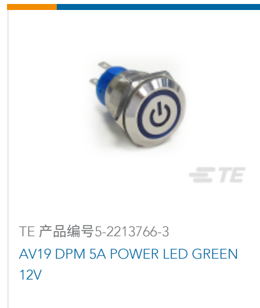
TE 产品编号5-2213766-3 AV19 DPM 5A POWER LED GREEN 12V