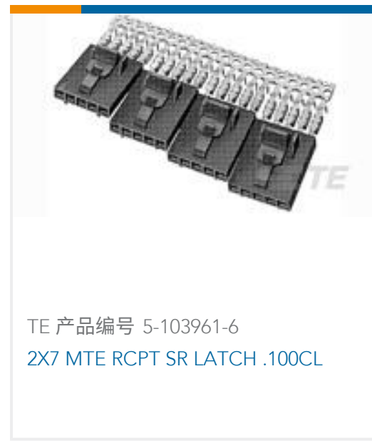
TE 产品编号 5-103961-6 2X7 MTE RCPT SR LATCH .100CL