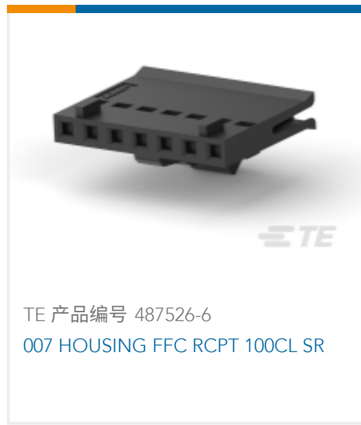
TE 产品编号 487526-6 007 HOUSING FFC RCPT 100CL SR