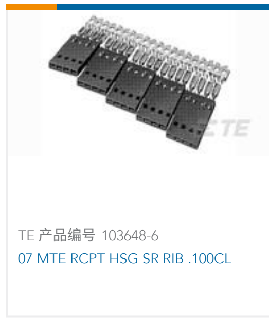
TE 产品编号 103648-6 07 MTE RCPT HSG SR RIB .100CL