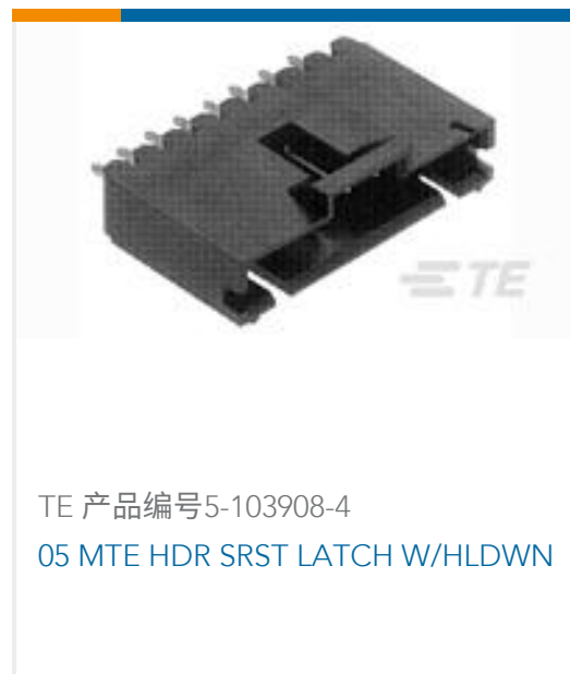
TE 产品编号5-103908-4 05 MTE HDR SRST LATCH W/HLDWN