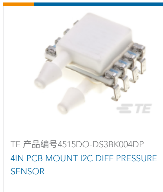
TE 产品编号4515DO-DS3BK004DP 4IN PCB MOUNT I2C DIFF PRESSURE SENSOR