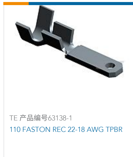
TE 产品编号63138-1 110 FASTON REC 22-18 AWG TPBR