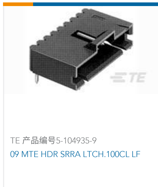
TE 产品编号5-104935-9 09 MTE HDR SRRA LTCH.100CL LF