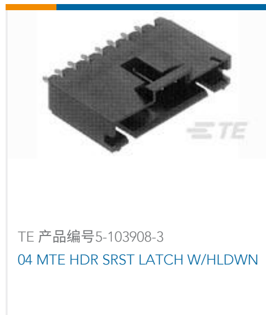
TE 产品编号5-103908-3 04 MTE HDR SRST LATCH W/HLDWN