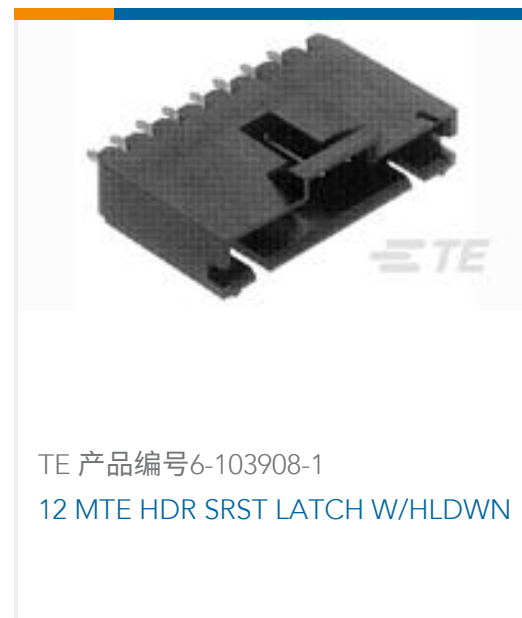
TE 产品编号6-103908-1 12 MTE HDR SRST LATCH W/HLDWN