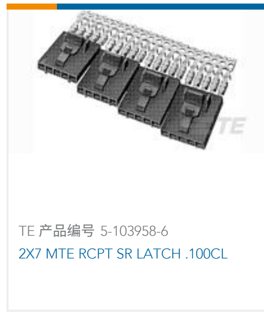
TE 产品编号 5-103958-6 2X7 MTE RCPT SR LATCH .100CL