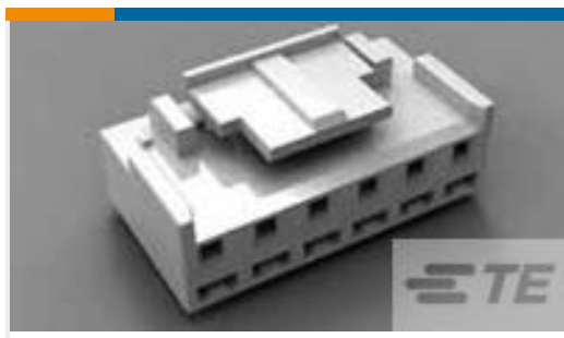
TE 产品编号1-1123722-3 3.96 EP PLUG HSG 3P(NATURAL)