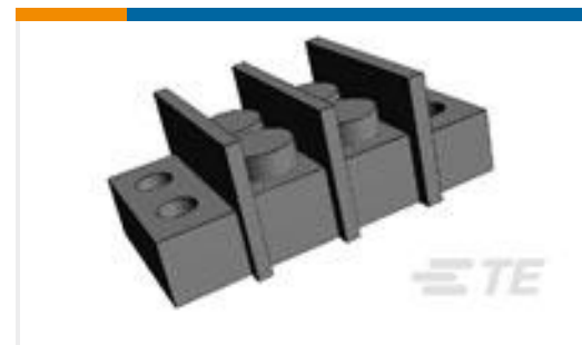
TE 产品编号1546306-2 2P .374" DR BARRIER STRIP