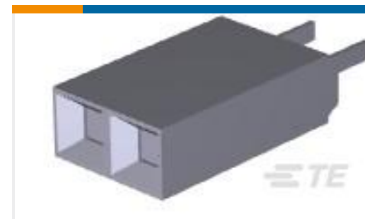
TE 产品编号5-534206-1 02 MODII VRT DR CE 100/115