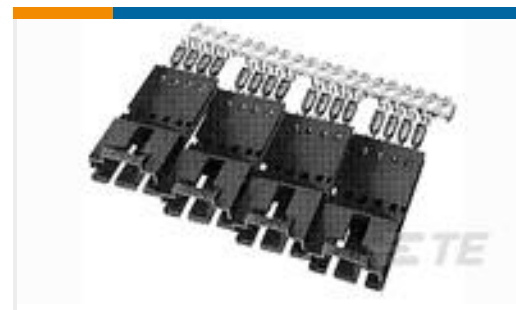
TE 产品编号5-103946-6 3X7 MTE SHRD PIN SR POL .100CL