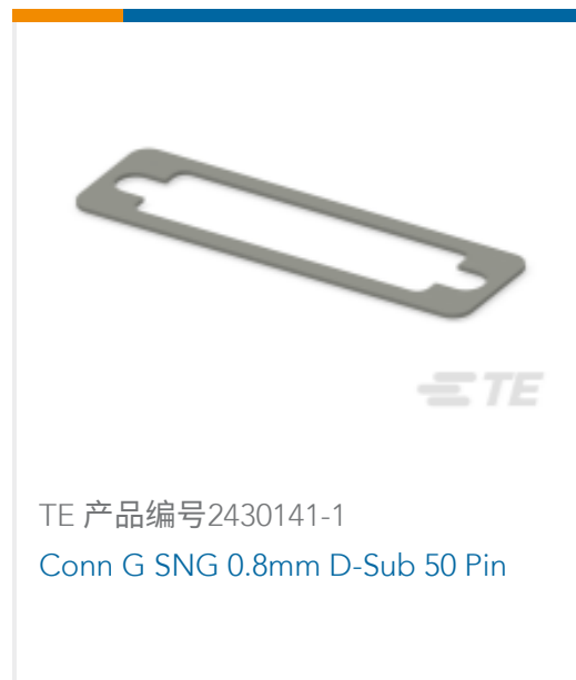
TE 产品编号2430141-1 Conn G SNG 0.8mm D-Sub 50 Pin