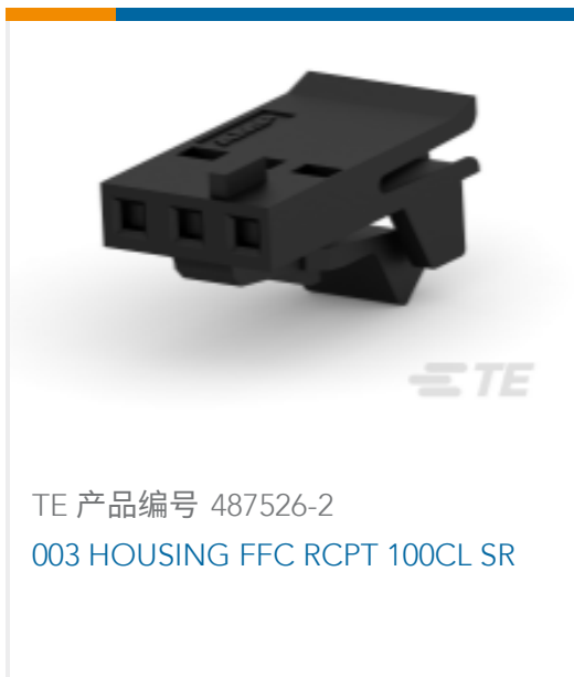
TE 产品编号 487526-2 003 HOUSING FFC RCPT 100CL SR