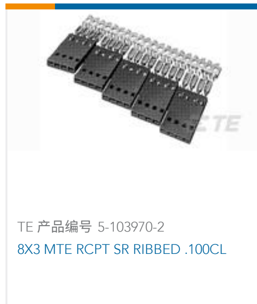
TE 产品编号 5-103970-2 8X3 MTE RCPT SR RIBBED .100CL