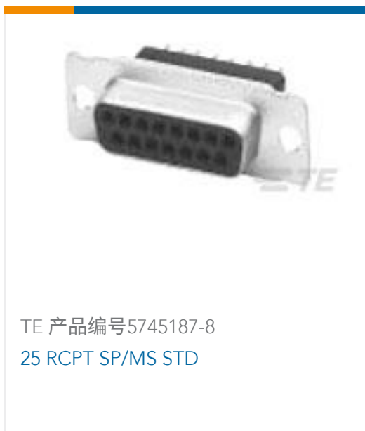
TE 产品编号5745187-8 25 RCPT SP/MS STD