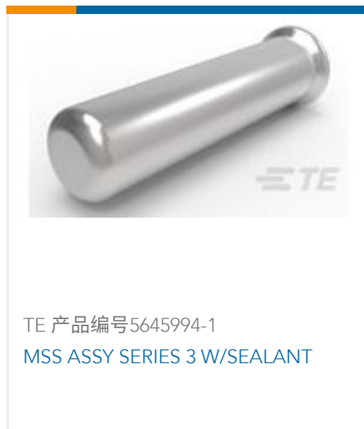
TE 产品编号5645994-1 MSS ASSY SERIES 3 W/SEALANT