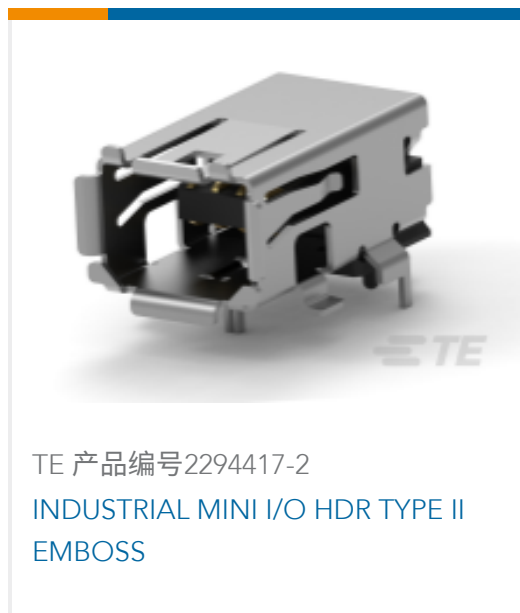
TE 产品编号2294417-2 INDUSTRIAL MINI I/O HDR TYPE II EMBOSS