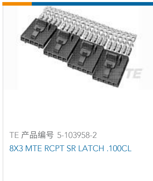
TE 产品编号 5-103958-2 8X3 MTE RCPT SR LATCH .100CL