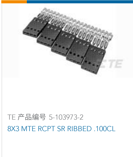
TE 产品编号 5-103973-2 8X3 MTE RCPT SR RIBBED .100CL