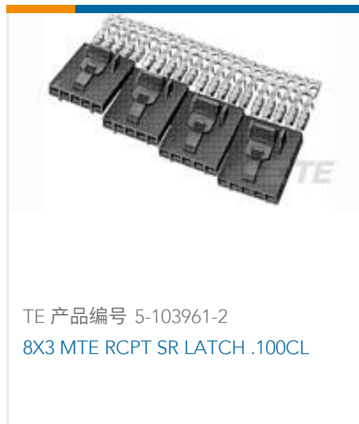
TE 产品编号 5-103961-2 8X3 MTE RCPT SR LATCH .100CL