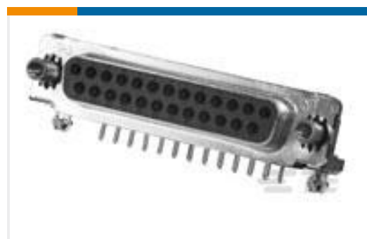
TE 产品编号5747844-5 09 MSFL RCPT RA 318 (SL,FM,BL)