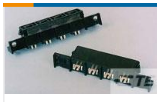
TE 产品编号556881-3 RCPT ASY,VRT,AMPINRGY WTB,3POS