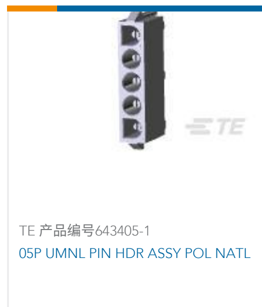
TE 产品编号643405-1 05P UMNL PIN HDR ASSY POL NATL