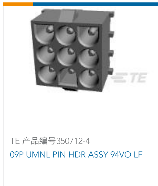
TE 产品编号350712-4 09P UMNL PIN HDR ASSY 94VO LF