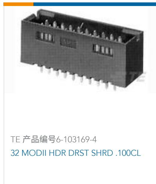
TE 产品编号6-103169-4 32 MODII HDR DRST SHRD .100CL