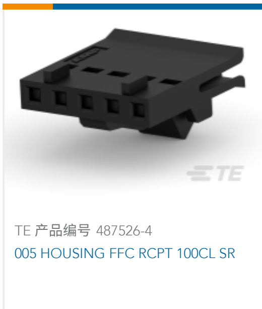
TE 产品编号 487526-4 005 HOUSING FFC RCPT 100CL SR