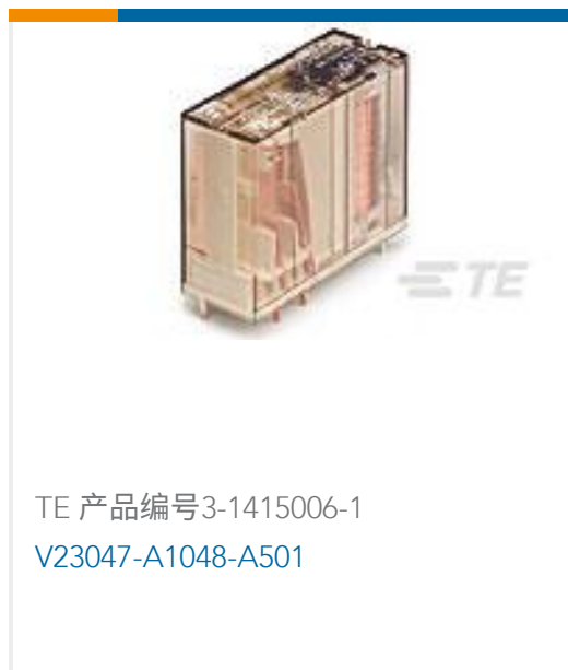
TE 产品编号3-1415006-1 V23047-A1048-A501