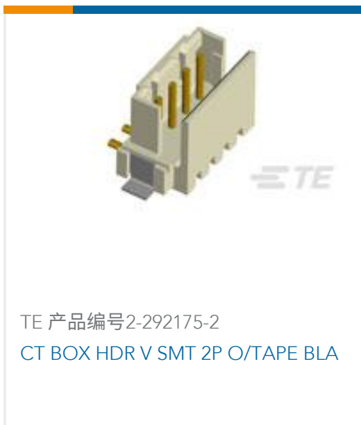
TE 产品编号2-292175-2 CT BOX HDR V SMT 2P O/TAPE BLA