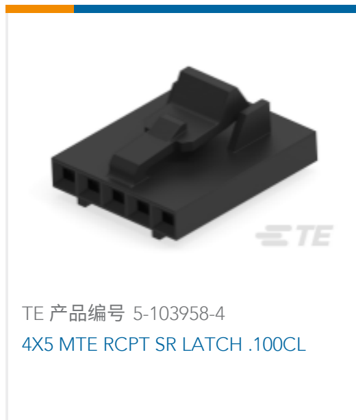
TE 产品编号 5-103958-4 4X5 MTE RCPT SR LATCH .100CL