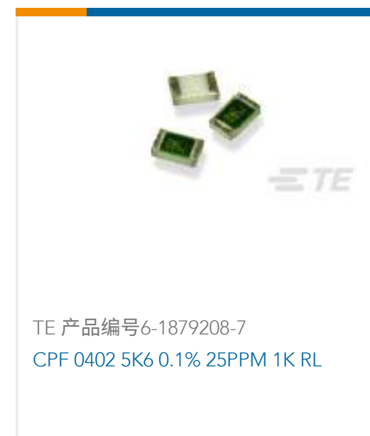
TE 产品编号6-1879208-7 CPF 0402 5K6 0.1% 25PPM 1K RL