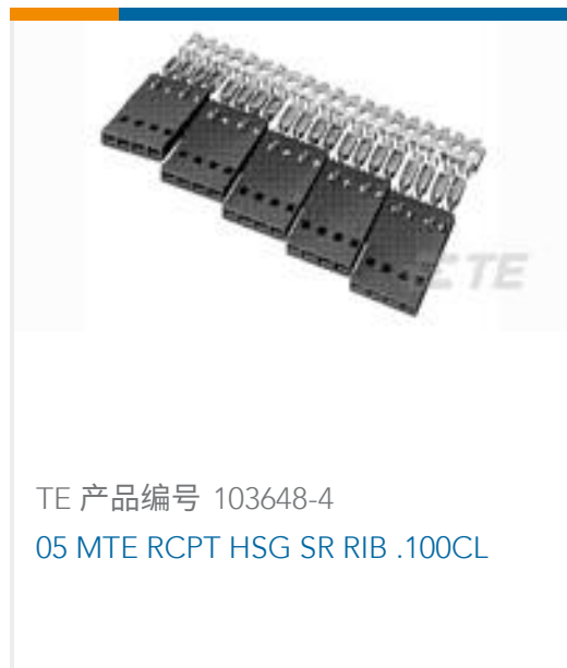
TE 产品编号 103648-4 05 MTE RCPT HSG SR RIB .100CL