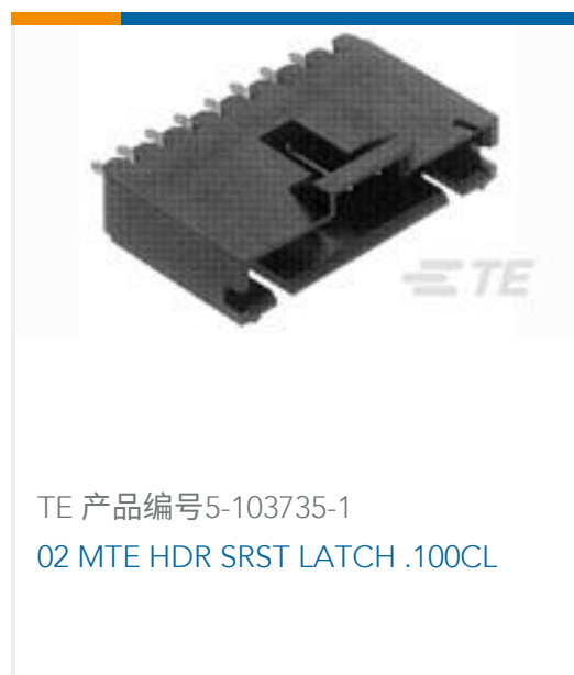
TE 产品编号5-103735-1 02 MTE HDR SRST LATCH .100CL