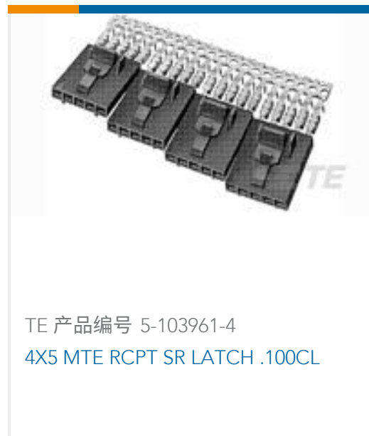
TE 产品编号 5-103961-4 4X5 MTE RCPT SR LATCH .100CL