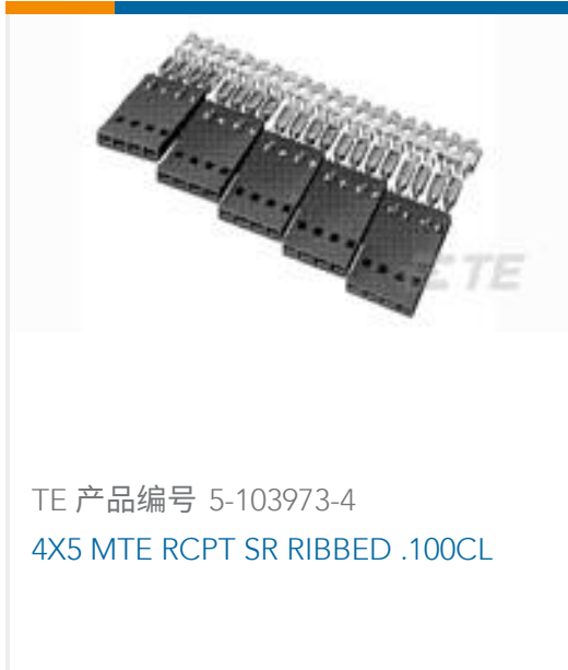
TE 产品编号 5-103973-4 4X5 MTE RCPT SR RIBBED .100CL