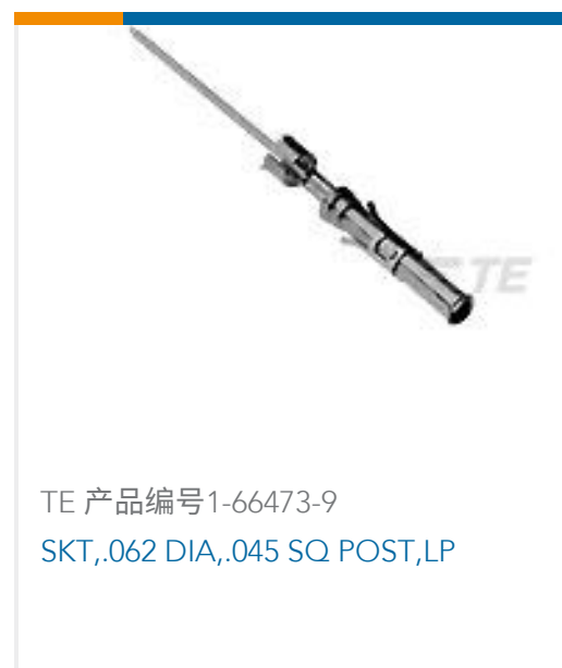
TE 产品编号1-66473-9 SKT,.062 DIA,.045 SQ POST,LP