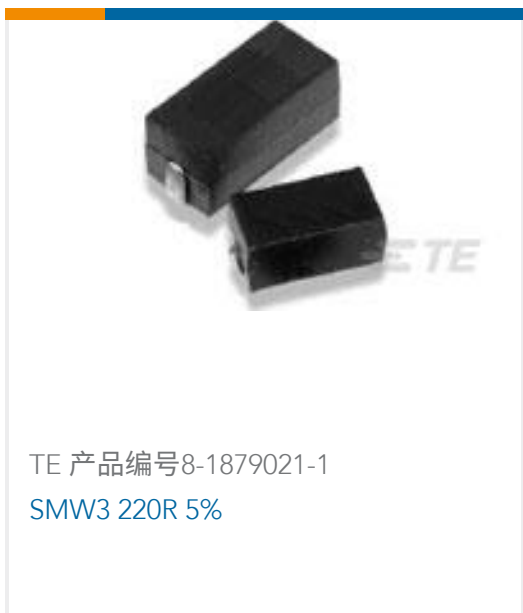
TE 产品编号8-1879021-1 SMW3 220R 5%