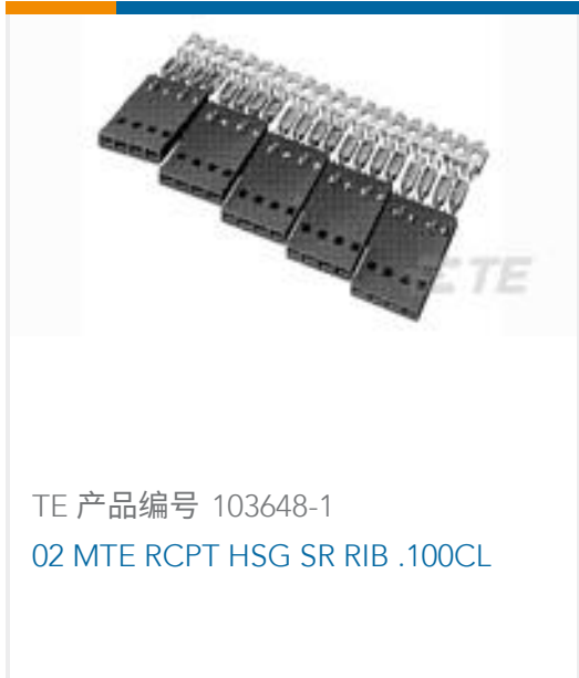
TE 产品编号 103648-1 02 MTE RCPT HSG SR RIB .100CL