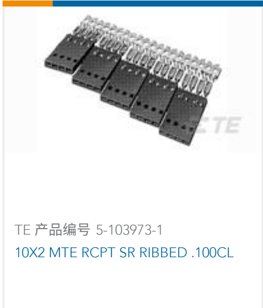
TE 产品编号 5-103973-1 10X2 MTE RCPT SR RIBBED .100CL