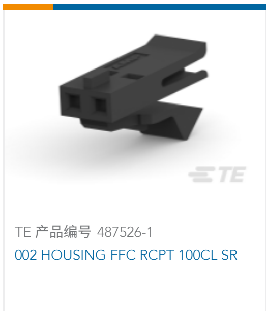
TE 产品编号 487526-1 002 HOUSING FFC RCPT 100CL SR