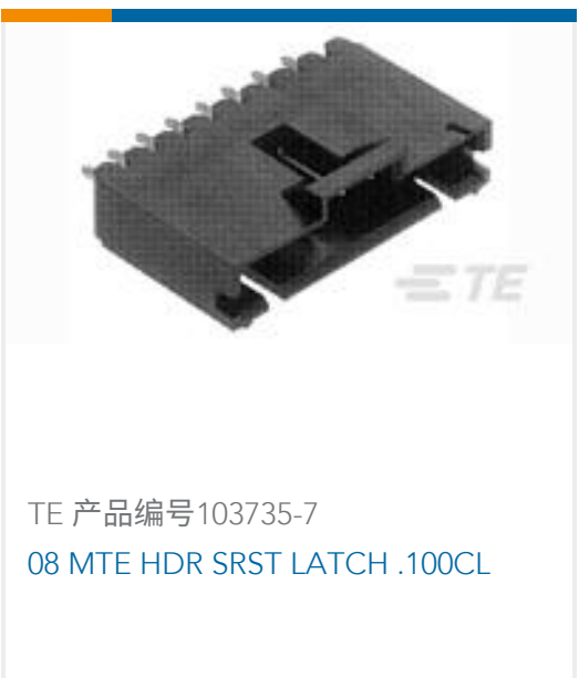
TE 产品编号103735-7 08 MTE HDR SRST LATCH .100CL