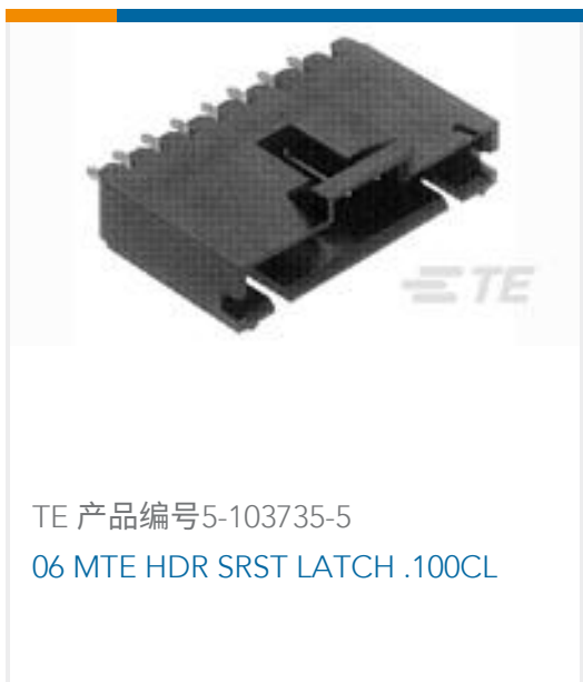
TE 产品编号5-103735-5 06 MTE HDR SRST LATCH .100CL