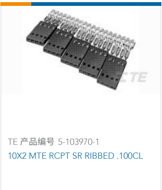
TE 产品编号 5-103970-1 10X2 MTE RCPT SR RIBBED .100CL