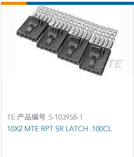
TE 产品编号 5-103958-1 10X2 MTE RPT SR LATCH .100CL