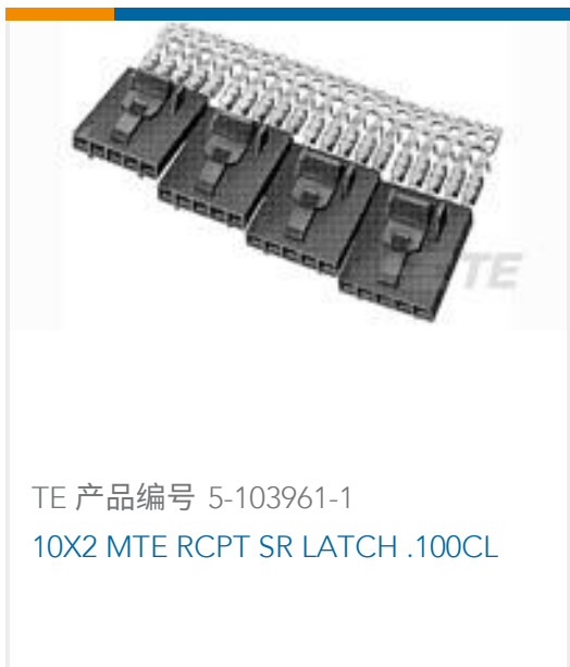
TE 产品编号 5-103961-1 10X2 MTE RCPT SR LATCH .100CL