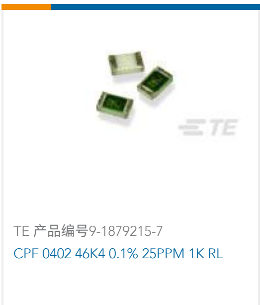
TE 产品编号9-1879215-7 CPF 0402 46K4 0.1% 25PPM 1K RL