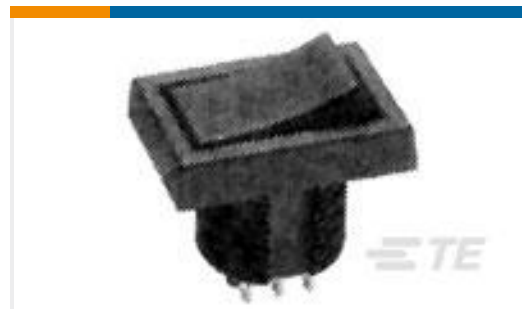
TE 产品编号1825423-1 TRD23N10QC04 rocker switch