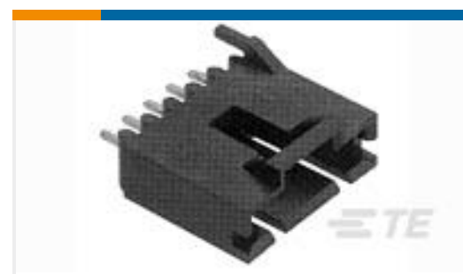
TE 产品编号5-104809-3 04 MTE HDR SRST LATCH W/HLDWN