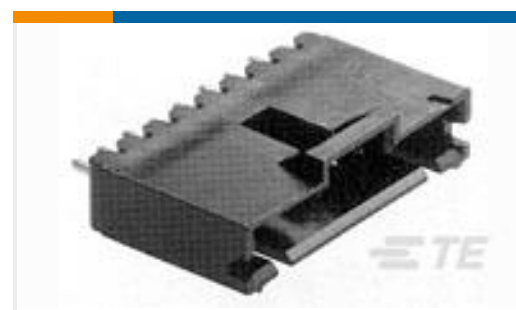
TE 产品编号5-104362-1 02 MTE HDR SRST LATCH W/HLDWN