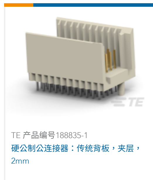
TE 产品编号188835-1 硬制公连接器：传统背板，夹层， 2mm