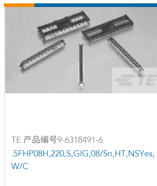
TE 产品编号9-6318491-6 .5FHP08H,220,S,GIG,08/Sn,HT,NSYes, W/C