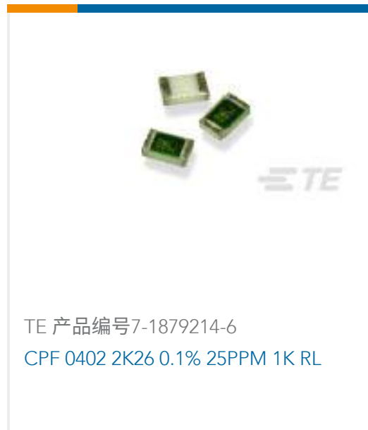
TE 产品编号7-1879214-6 CPF 0402 2K26 0.1% 25PPM 1K RL