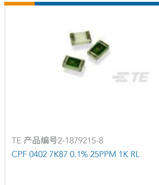
TE 产品编号2-1879215-8 CPF 0402 7K87 0.1% 25PPM 1K RL