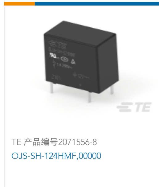
TE 产品编号2071556-8 OJS-SH-124HMF,00000