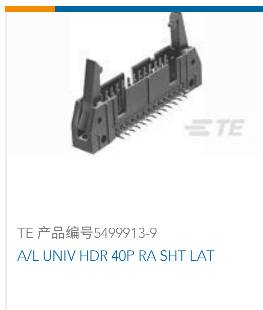
TE 产品编号5499913-9 A/L UNIV HDR 40P RA SHT LAT