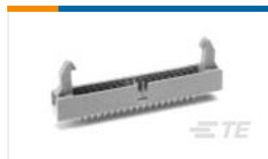
TE 产品编号1761686-3 IDC LOW PRO HDR 10P VERT LG LAT