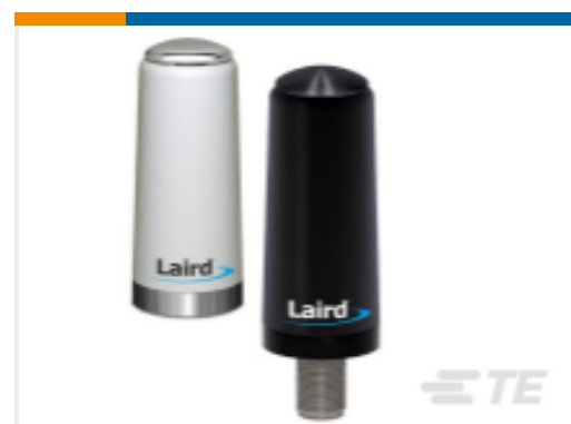
TE 产品编号TRA6927M3PW-001 OMNI, DB, Ph, 698/1710 MHz WHT, 3 dBi, 100W,