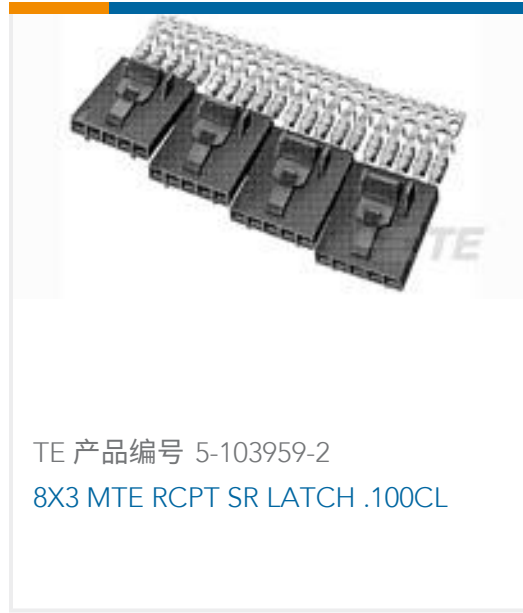
TE 产品编号 5-103959-2 8X3 MTE RCPT SR LATCH .100CL