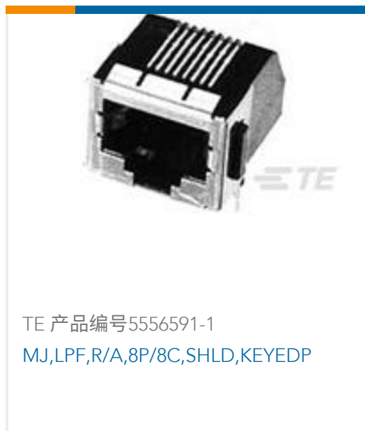
TE 产品编号5556591-1 MJ,LPF,R/A,8P/8C,SHLD,KEYEDP