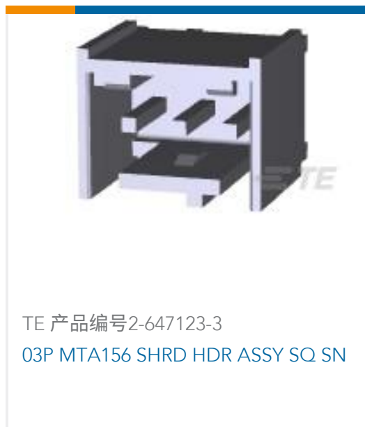
TE 产品编号2-647123-3 03P MTA156 SHRD HDR ASSY SQ SN