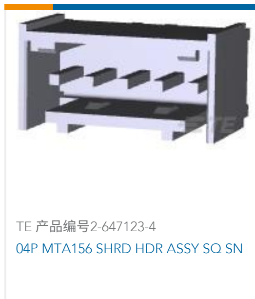
TE 产品编号2-647123-4 04P MTA156 SHRD HDR ASSY SQ SN