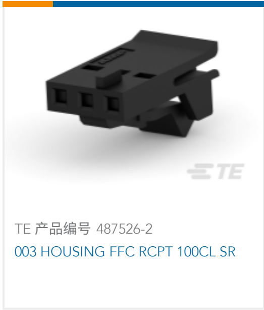
TE 产品编号 487526-2 003 HOUSING FFC RCPT 100CL SR