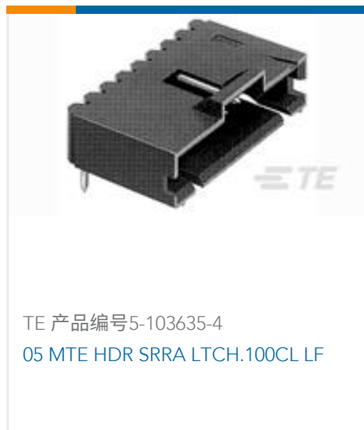
TE 产品编号5-103635-4 05 MTE HDR SRRR LTCH.100CL LF