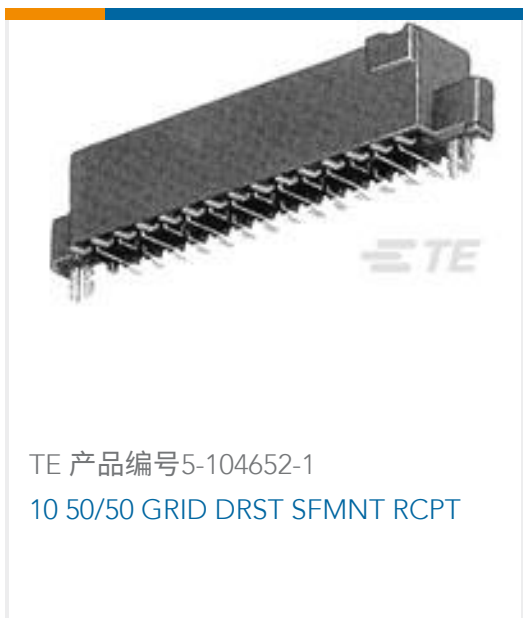
TE 产品编号5-104652-1 10 50/50 GRID DRST SFMNT RCPT