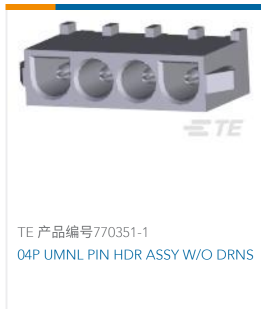
TE 产品编号770351-1 04P UMNL PIN HDR ASSY W/O DRNS