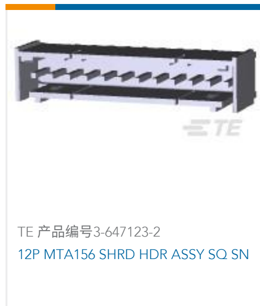
TE 产品编号3-647123-2 12P MTA156 SHRD HDR ASSY SQ SN