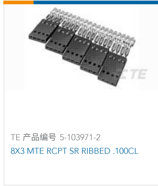
TE 产品编号 5-103971-2 8X3 MTE RCPT SR RIBBED .100CL