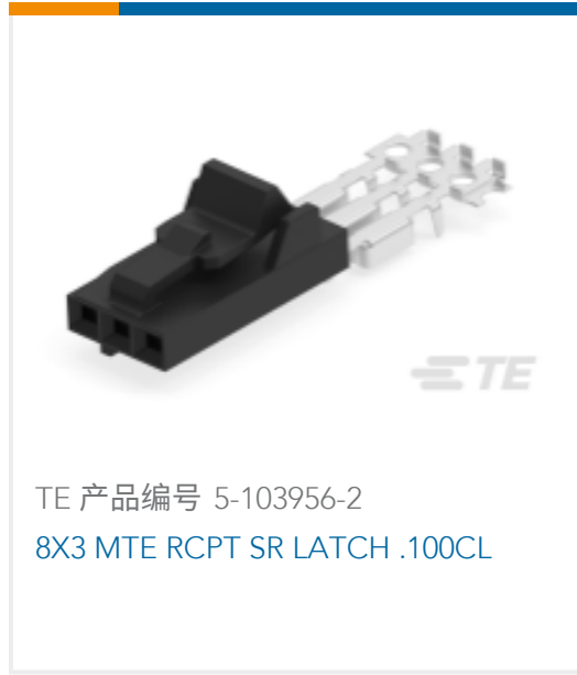
TE 产品编号 5-103956-2 8X3 MTE RCPT SR LATCH .100CL