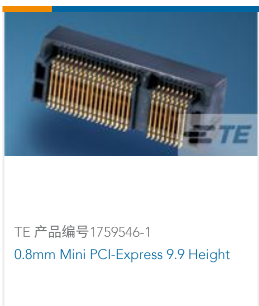
TE 产品编号1759546-1 0.8mm Mini PCI-Express 9.9 Height