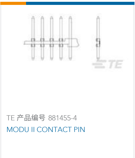
TE 产品编号 881455-4 MODU II CONTACT PIN