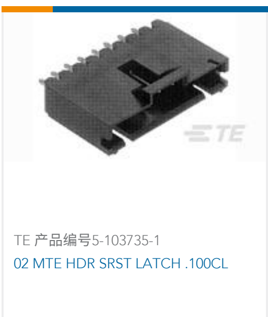
TE 产品编号5-103735-1 02 MTE HDR SRST LATCH .100CL