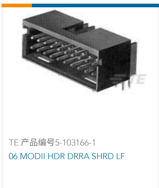
TE 产品编号5-103166-1 06 MODII HDR DRRR SHRD LF