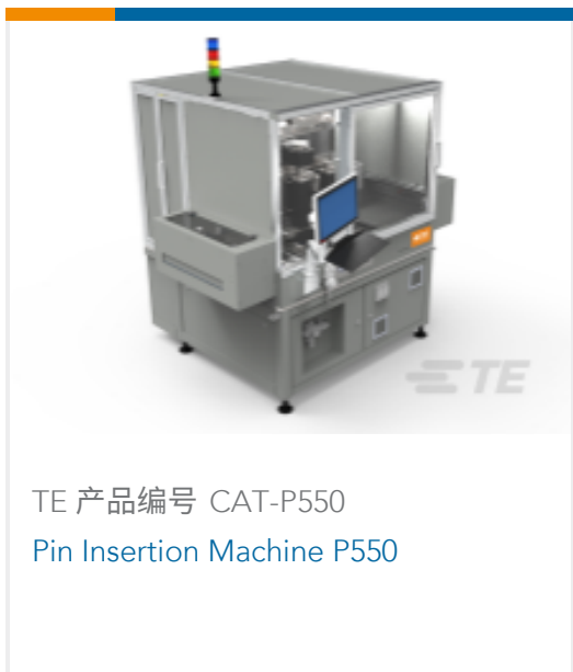
TE 产品编号 CAT-P550 Pin Insertion Machine P550