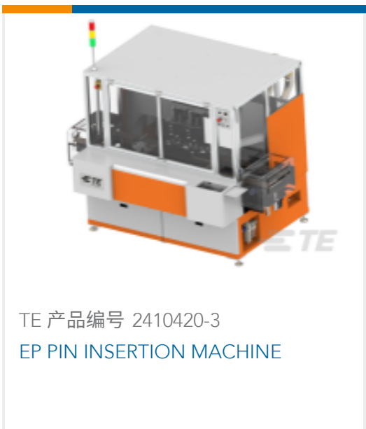
TE 产品编号 2410420-3 EP PIN INSERTION MACHINE