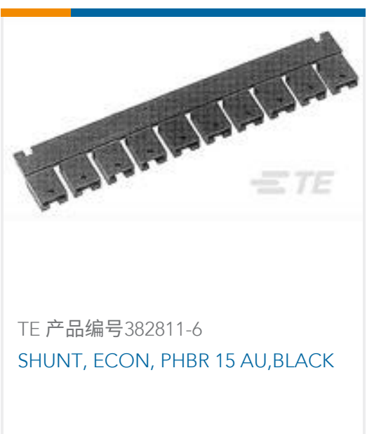
TE 产品编号382811-6 SHUNT, ECON, PHBR 15 AU, BLACK