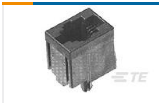
TE 产品编号5520258-3 M/JTOP6P/6CPNL STOPSTRAY P