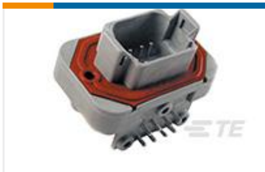
TE 产品编号DT13-08PA HDR, 8P, GRY, RA, NI/CU, A