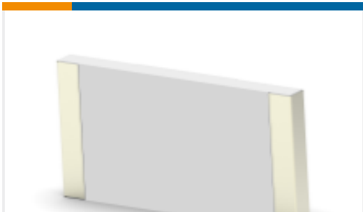
TE 产品编号7-2176246-6 CRGS2512 5% 1M8