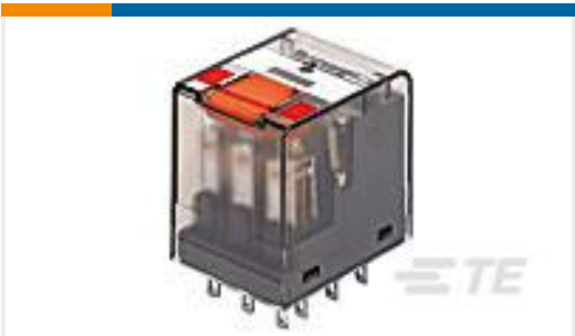
TE 产品编号3-1415020-1 PT570N20