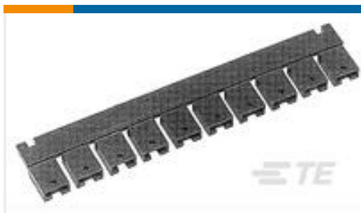
TE 产品编号2-382811-0 ECONOMY SHUNT, 30 AU BLACK