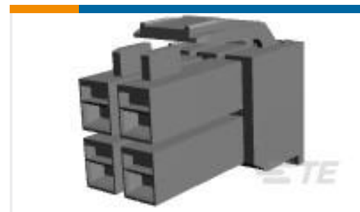
TE 产品编号176273-1 AMP UNIVERSAL POWR PLUG 4P