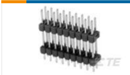
TE 产品编号5-146486-3 06 MODII HDR DRST UNSHRD STKG