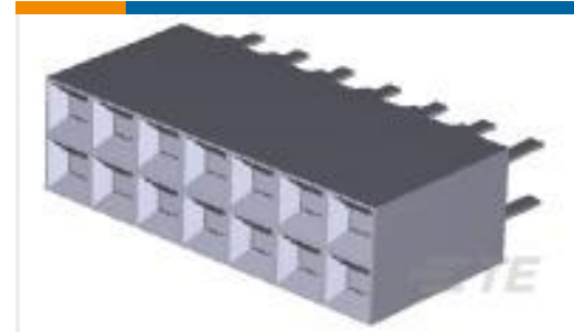
TE 产品编号5-534206-7 14 MODII VRT DR CE 100/115