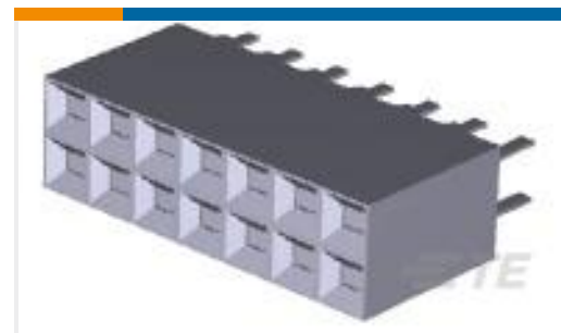
TE 产品编号5-534206-7 14 MODII VRT DR CE 100/115