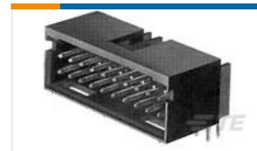
TE 产品编号6-103166-0 24 MODII HDR DRRR SHRD LF