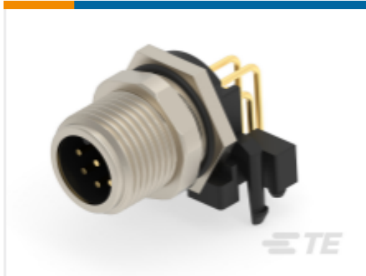
TE 产品编号T4144015081-000 M12 RA PCB CONN. Male 8 P UN SHIELD