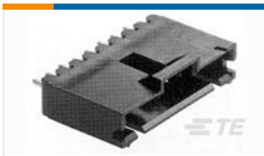
TE 产品编号5-104363-5 06 MTE HDR SRST LATCH .100CL