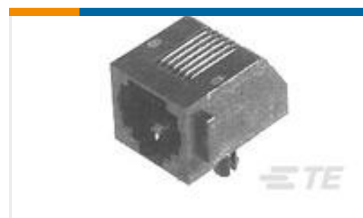
TE 产品编号5555164-4 MJ,LPF,R/A,8P,TUBE