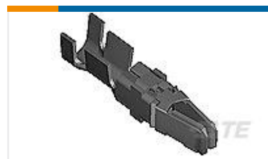
TE 产品编号1-66740-9 TYPE XII FEMALE CONT (STRIP)