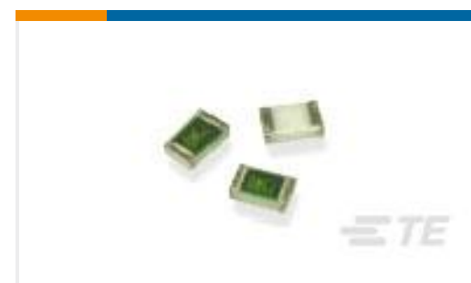
TE 产品编号1676467-2 RN 0805 95K3 0.1% 10PPM 1KRL