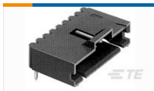
TE 产品编号5-104935-6 05 MTE HDR SRRA LTCH.100CL LF