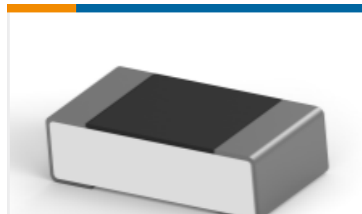
TE 产品编号3-2176368-2 RQ 0603 105K 0.1% 10PPM 1K RL