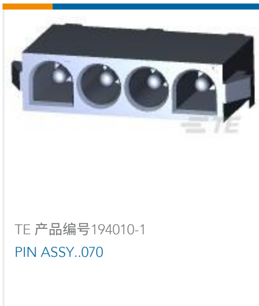
TE 产品编号194010-1 PIN ASSY..070