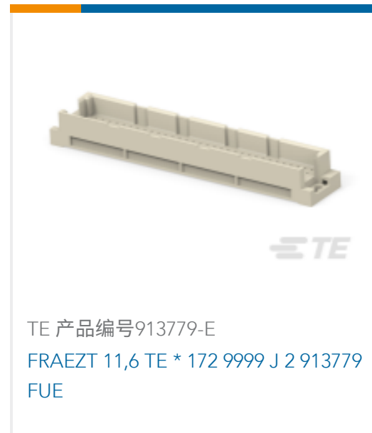
TE 产品编号913779-E FRAEZT 11,6 TE * 172 9999 J 2 913779 FUE