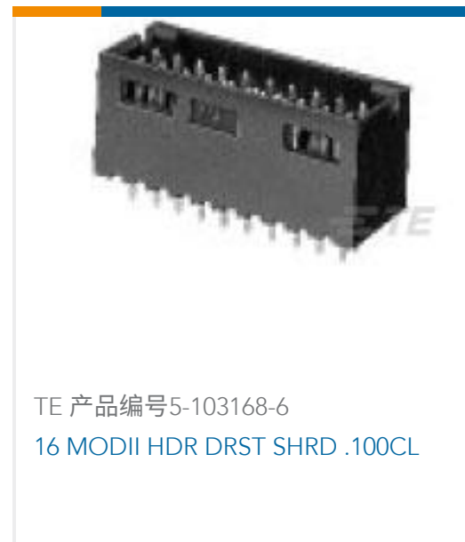
TE 产品编号5-103168-6 16 MODII HDR DRST SHRD .100CL