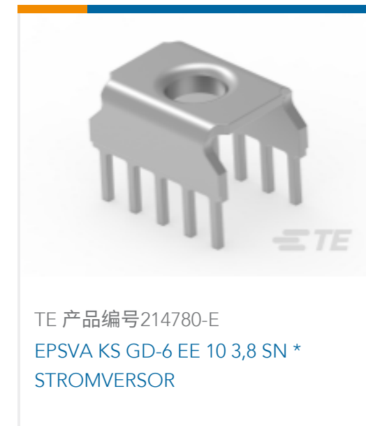
TE 产品编号214780-E EPSVA KS GD-6 EE 10 3,8 SN * STROMVERSOR