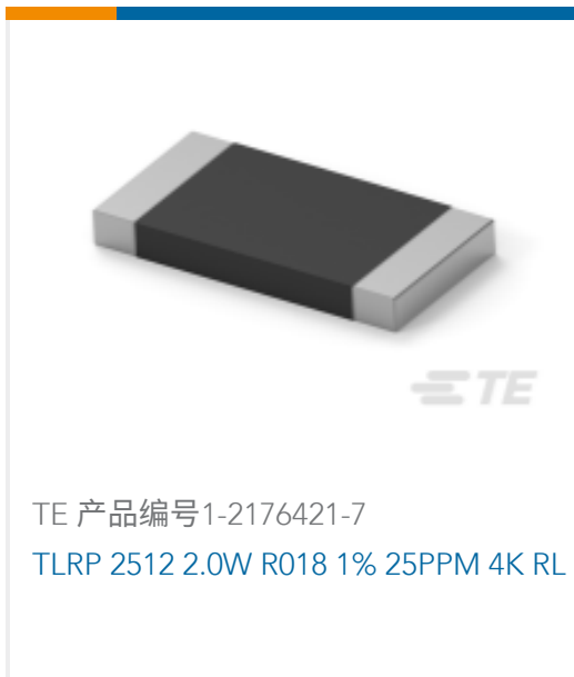
TE 产品编号1-2176421-7 TLRP 2512 2.0W R018 1% 25PPM 4K RL