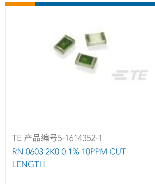
TE 产品编号5-1614352-1 RN 0603 2K0 0.1% 10PPM CUT LENGTH