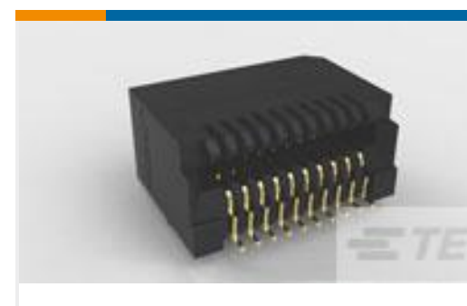
TE 产品编号1367073-2 20 POS SMT CONN, SFP, 30AU