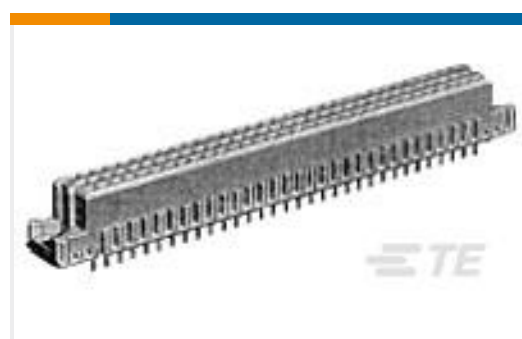
TE 产品编号5535043-4 ASSY,RECEPTACLE,EUROCARD,TYPE