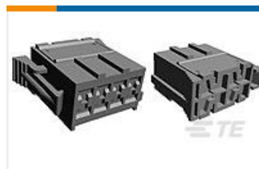
TE 产品编号927366-1 8P MIN D-FLACHF GEH