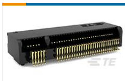
TE 产品编号2199230-3 M.2 0.5PITCH 4.2H KEY B 15U" AU