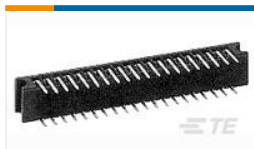
TE 产品编号 5-534975-5 12 MODII 2PC DR CE RECPT ASSY, RoHS