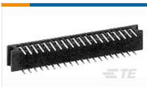
TE 产品编号 5-532955-1 12 MODII 2PC CE RCPT ASSY, RoHS