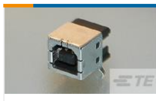
TE 产品编号292304-1 STD USB TYPE B, R/A, T/H