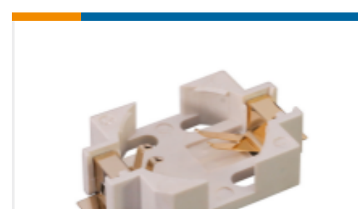
TE 产品编号BAT-HLD-010-SMT-TR Battery Holder 1632 SMT T&R Pack