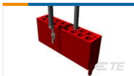
TE 产品编号338095-4 MICRO-MATCH COSIHSG