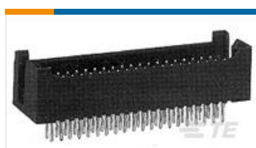
TE 产品编号6-102692-7 30 MODII 2PC HDR DR SHRD, ROHS