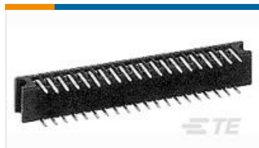
TE 产品编号 5-532955-9 60 MODII 2PC CE RCPT ASSY, RoHS