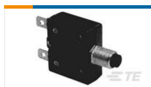
TE 产品编号7-1423674-8 W54-XB1A4A10-35=CKTBKR, THERM,P