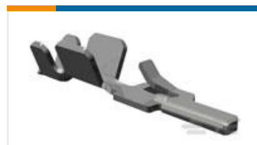
TE 产品编号1-338097-1 MICRO-MATCH COSICNT