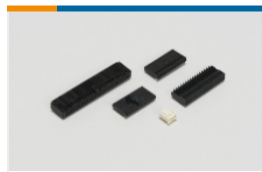
线到板连接器组件和护套(5)