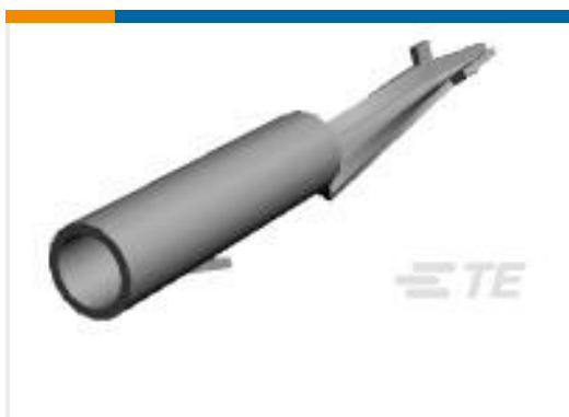
TE 产品编号61320-1 CMNL PCB SOK PTPHBZ