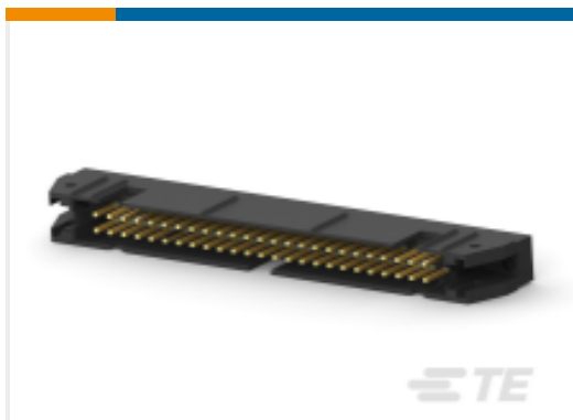
TE 产品编号5102321-2 AMP 锁门通用插头