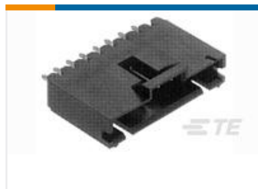
TE 产品编号103670-4 05 MTE HDR SRST LATCH W/HLDWN