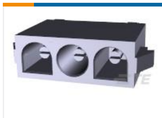
TE 产品编号350583-4 03P UMNL PIN HDR ASSY V2 LF