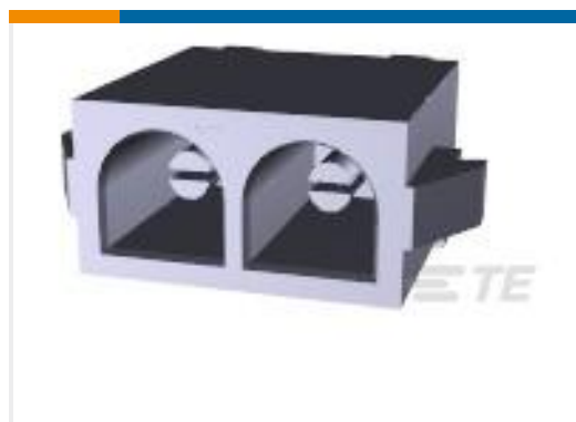
TE 产品编号350582-4 02P UMNL PIN HDR ASSY V2 LF