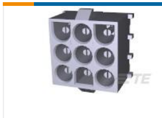
TE 产品编号350586-4 09P UMNL HDR ASSY PC NATL LF