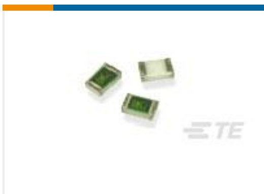
TE 产品编号1676310-2 RN 0805 34K8 0.1% 10PPM 1KRL