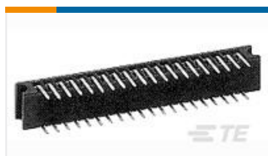
TE 产品编号 5-532955-6 36 MODII 2PC CE RCPT ASSY, RoHS