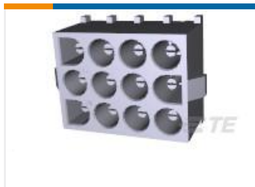
TE 产品编号350587-1 12P UMNL PIN HDR ASSY V2 NATL