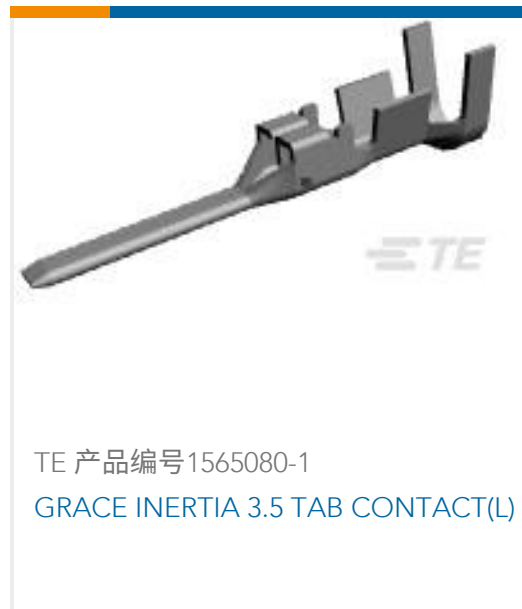
TE 产品编号1565080-1 GRACE INERTIA 3.5 TAB CONTACT(L)