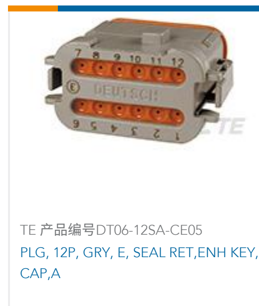
TE 产品编号DT06-12SA-CE05 PLG, 12P, GRY, E, SEAL RET, ENH KEY, CAP, A