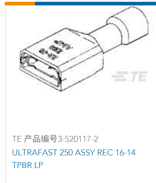
TE 产品编号3-520117-2 ULTRAFast 250 ASSY REC 16-14 TPBR LP