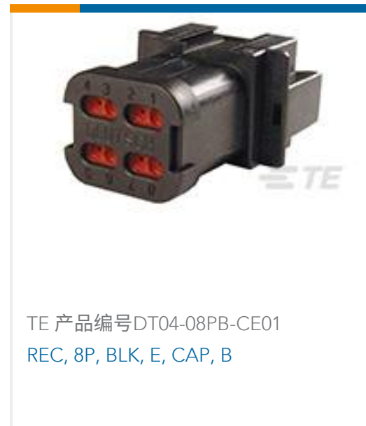
TE 产品编号DT04-08PB-CE01 REC, 8P, BLK, E, CAP, B