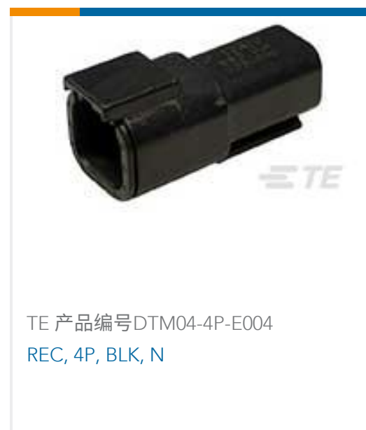
TE 产品编号DTM04-4P-E004 REC, 4P, BLK, N