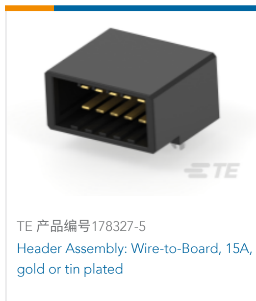
TE 产品编号178327-5 Header Assembly: Wire-to-Board, 15A, gold or tin plated