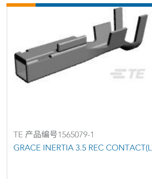
TE 产品编号1565079-1 GRACE INERTIA 3.5 REC CONTACT(L)