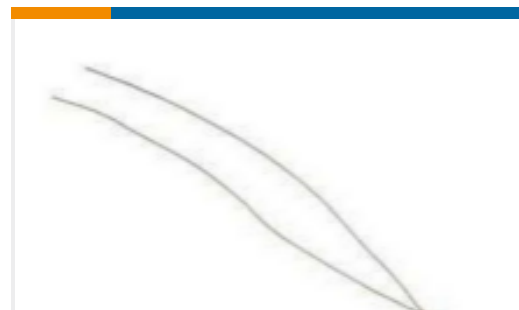
TE 产品编号SP44909X-18 44909X GSFC 311P18-09A101