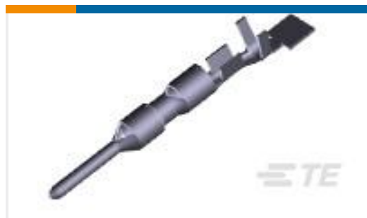
TE 产品编号1-794226-0 MINI UMNL2 PIN 26-22AWG LP LF