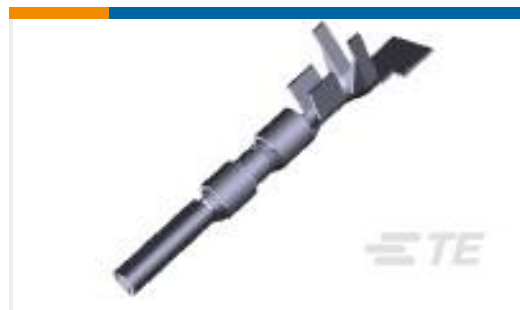
TE 产品编号1-794229-0 MINI UMNL2 SOK 22-18AWG LP LF