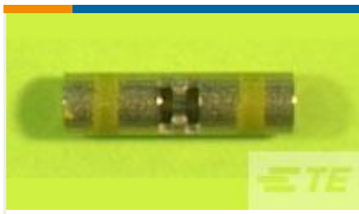
TE 产品编号680333-000 D-609-13