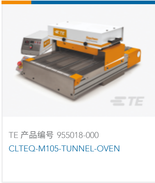
TE 产品编号 955018-000 CLTEQ-M105-TUNNEL-OVEN