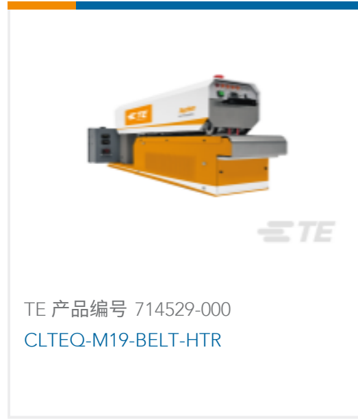
TE 产品编号 714529-000 CLTEQ-M19-BELT-HTR