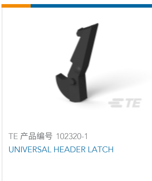
TE 产品编号 102320-1 UNIVERSAL HEADER LATCH