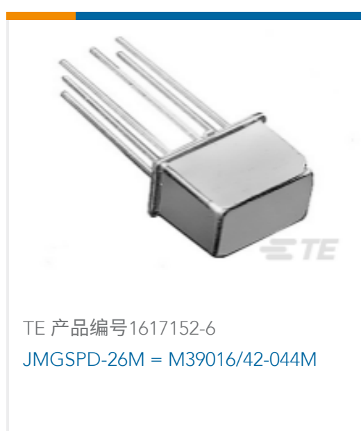
TE 产品编号1617152-6 JMGSPD-26M = M39016/42-044M