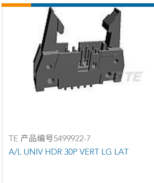
TE 产品编号5499922-7 A/L UNIV HDR 30P VERT LG LAT