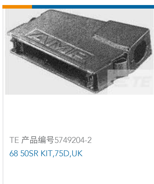
TE 产品编号5749204-2 68 50SR KIT,75D,UK