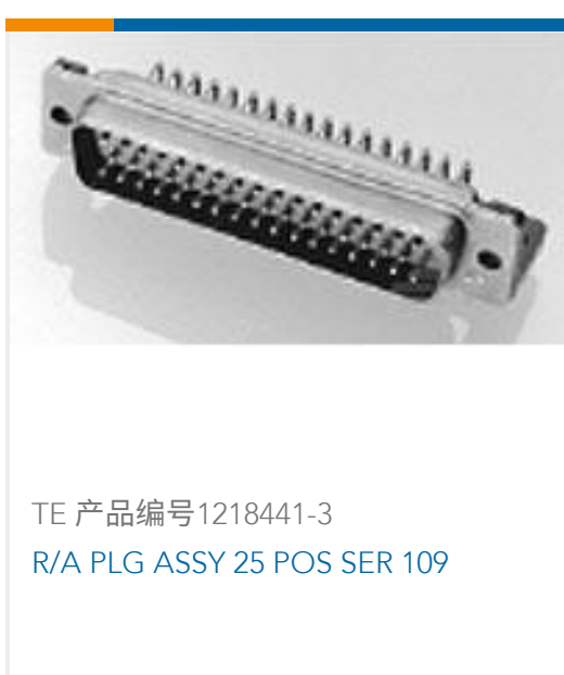
TE 产品编号1218441-3 R/A PLG ASSY 25 POS SER 109