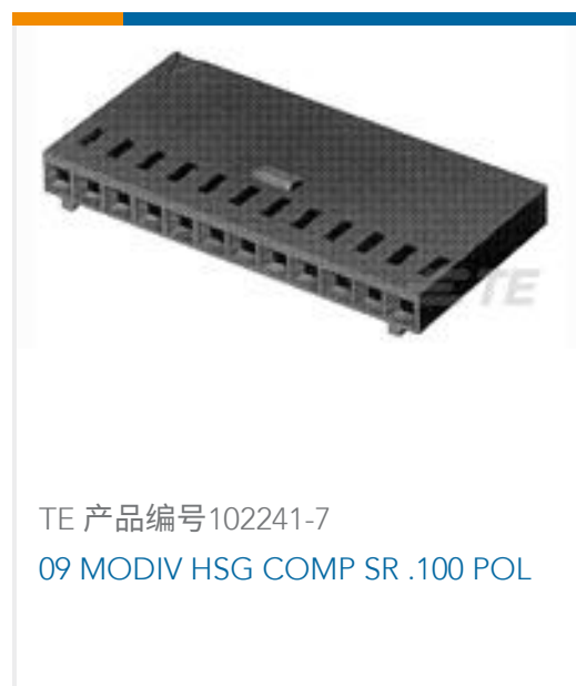
TE 产品编号102241-7 09 MODIV HSG COMP SR .100 POL