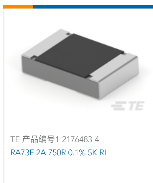
TE 产品编号1-2176483-4 RA73F 2A 750R 0.1% 5K RL