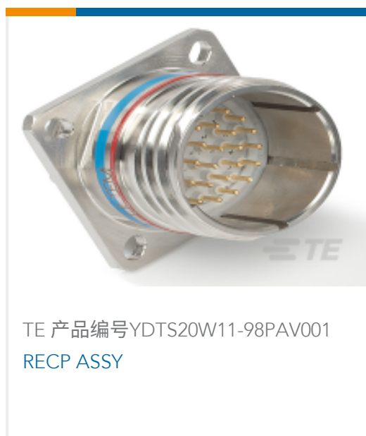
TE 产品编号YDTS20W11-98PAV001 RECP ASSY