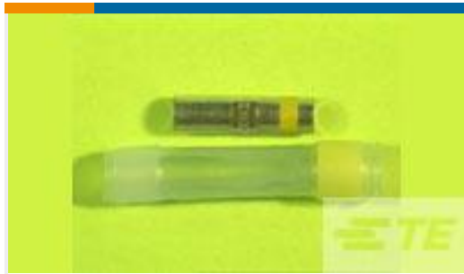
TE 产品编号 650076-000 D-436-38