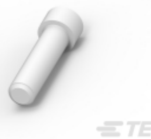
TE 产品编号114017-ZZ SEALING PLUG, SIZE 12/16, WHT