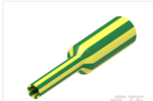
TE 产品编号CAT-HST-DCPT DCPT 热缩管