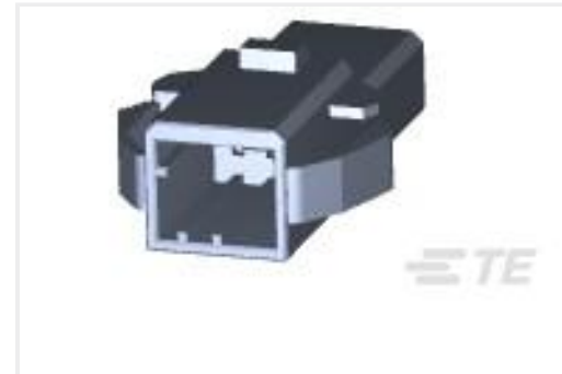
TE 产品编号2-1318116-3 DYNAMIC D2100 TAB HSG 3P P/M Y