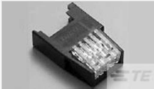
TE 产品编号2-1746741-4 RITS CONN. SOCKET ASSY 4P BLUE