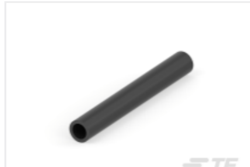
TE 产品编号CAT-HST-VERSAFITV2 Versafit-V2 Heat Shrink Tubing