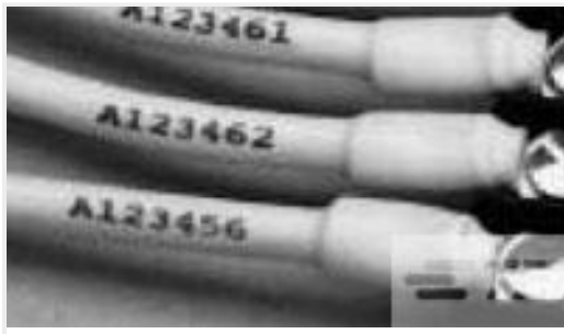
TE 产品编号505304J154 RNF-100-3/16-BK-SP-SM