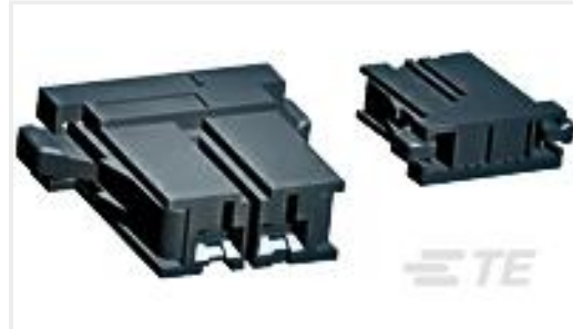
TE 产品编号2-1747276-2 DYNAMIC D4200 REC HSG 2P/Y