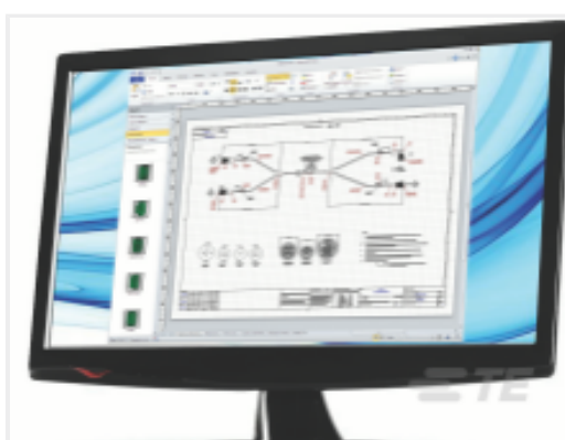
TE 产品编号 9-120035-6 HarnWare/HarnVis Renewal Charge