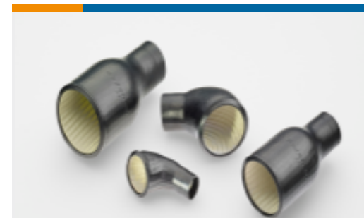
TE 产品编号EK7342-000 382S028-25C-CS-2064-0