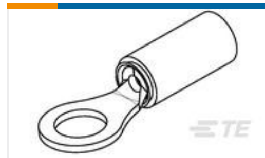
TE 产品编号1577633-1 TERMINAL RT PIDG PEEK STRATO 18-16 AWG