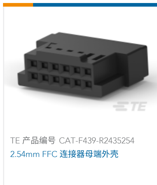
TE 产品编号 CAT-F439-R2435254 2.54mm FFC 连接器母端外壳