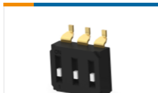
TE 零件编号4-2319848-5 END STACK DIP 3P G RECESS T&R