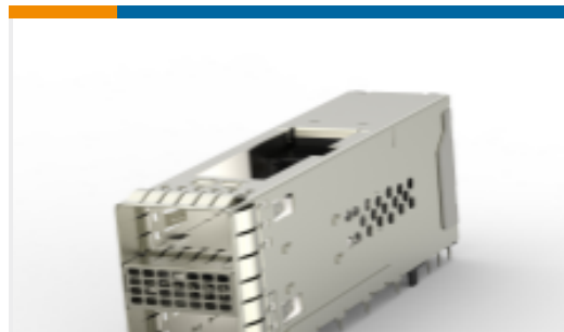
TE 零件编号2299940-4 ZQSFP+ STACKED REC ASSEMBLY 2X1,HS