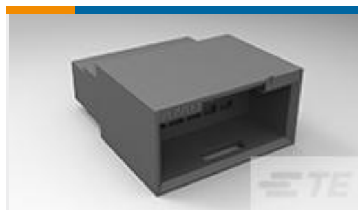
TE 零件编号88189-6 020 HOUSING FFC PIN DR 100CL