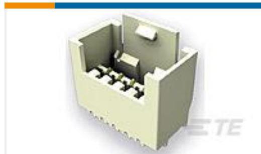
TE 零件编号3-1971817-4 4P,RAST 2.5 Tab Header, Ex- Locking,THV