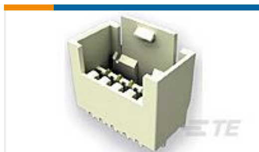
TE 零件编号3-1971817-8 8P,RAST 2.5 Tab Header, Ex- Locking,THV