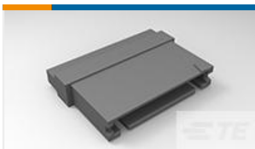
TE 零件编号1-485893-6 018 HOUSING FFC PIN 100CL SR