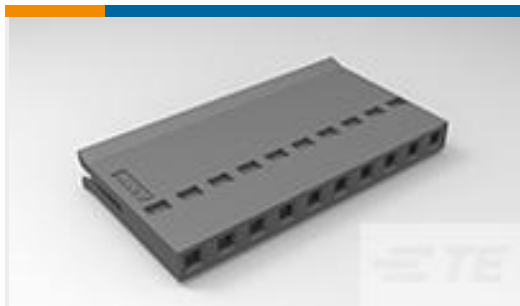
TE 零件编号1-487378-2 013 HOUSING FFC RCPT 100CL SR