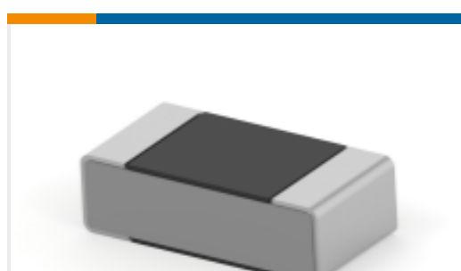
TE 产品编号3-2176263-1 RN 0402 49K9 0.1% 10PPM 5K RL