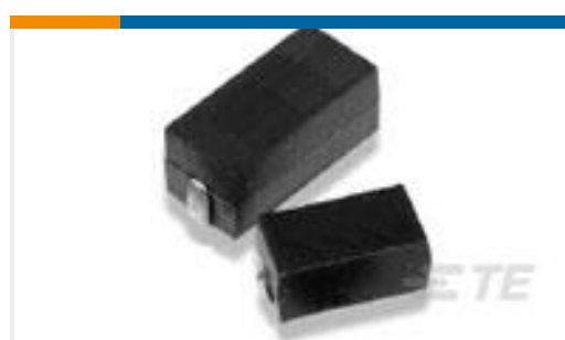
TE 产品编号4-1879021-9 SMW3 10R 5%