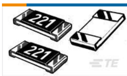
TE 产品编号4-1622820-8 3520 470R 5%