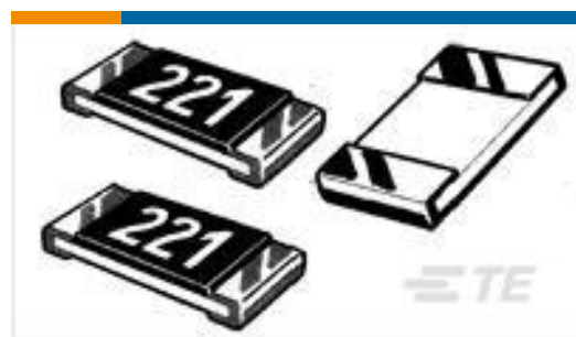
TE 产品编号9-2176070-1 3521 56K 1% 2W