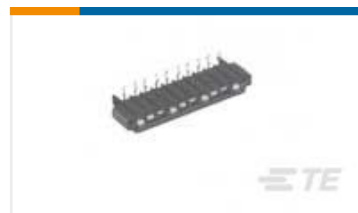
TE 产品编号6-520314-0 TRIOMATE ASSY H 10P L=2.54LDFR