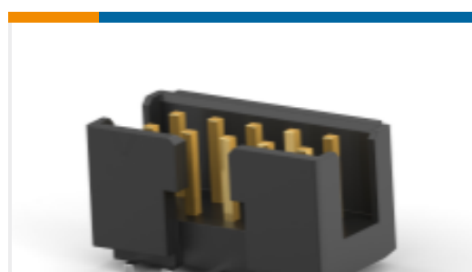
TE 产品编号1-2373376-0 10P,2MM,SHRD HDR,DRVT,SMD,0.1 AU,TB