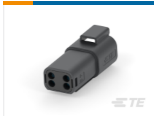
TE 产品编号1-2600030-0 4CCT BLACK RECEP W/LARGE SEAL