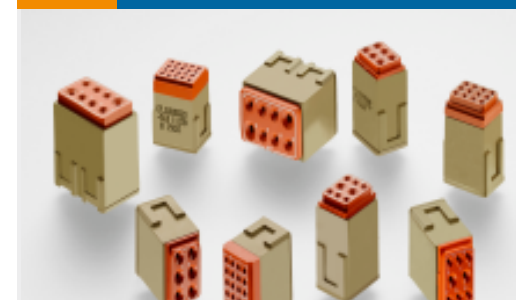
TE 产品编号CTJ120E01B-513 MODULE ASSY