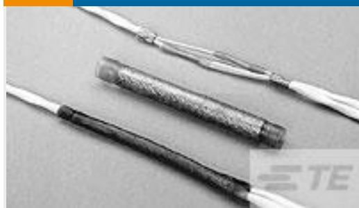
TE 产品编号727844-000 D-150-0175