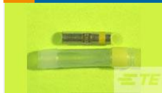
TE 产品编号650082-000 D-436-58