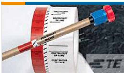
TE 产品编号458662-000 TP3-FUEL-0.625