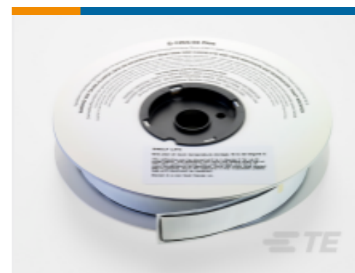
TE 产品编号195133-000 S1255-04-3/4X100FT