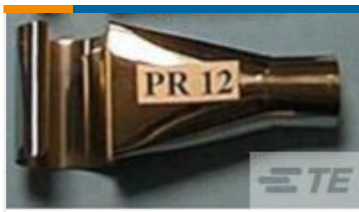
TE 产品编号 991973-000 PR-12-REFLECTOR