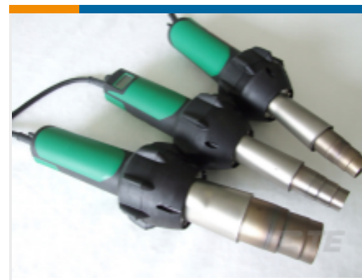
TE 产品编号 EG1118-000 CV1981-ST-120V1600W-US