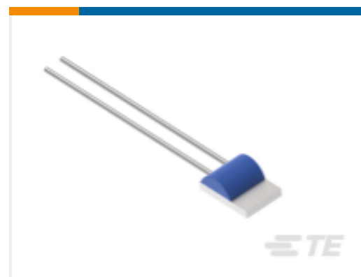
TE 产品编号NB-PTCO-046 Pt1000, 2.0x2.3, Class C, PTFC102C1G0