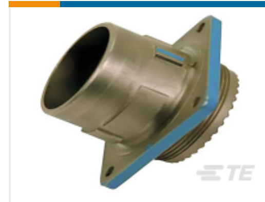
TE 产品编号YDIV46E25-61SNC128 PLUG ASSY