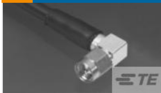
TE 产品编号1052203-1 2037 8126 92