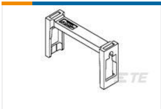
TE 产品编号4-100103-0 40P.A/L.STRAIN REL.