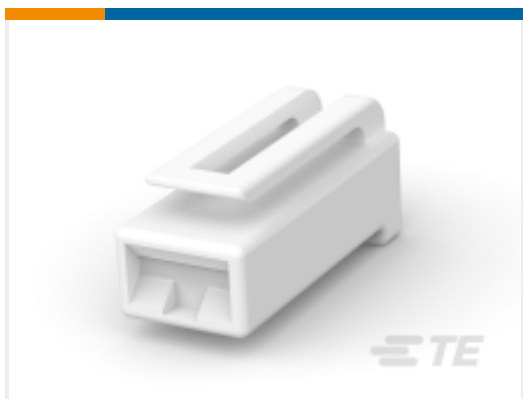
TE 产品编号 521743-1 FF 250 HOUSING RECEPTACLE NYLON 6/6