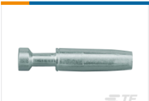
TE 产品编号T2030002010-000 CEF-1.0