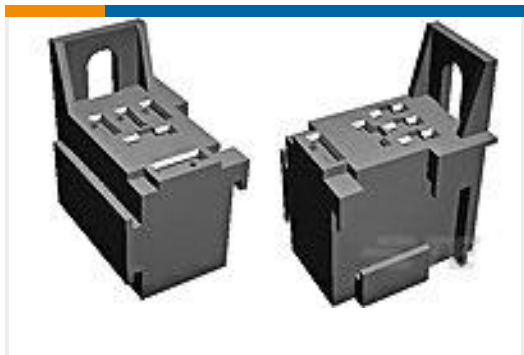
TE 产品编号3-1393310-8 VCFM-1002=SOCKET,VCFM,5,PC,PLA-