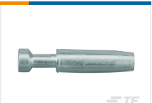
TE 产品编号T2030002015-000 CEF-1.5