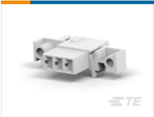
TE 产品编号 1-480252-0 FF 187 REC HSG 3P NYLON NAT