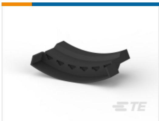
TE 产品编号 521381-1 FF 187 REC HSG 6P NYLON BLACK