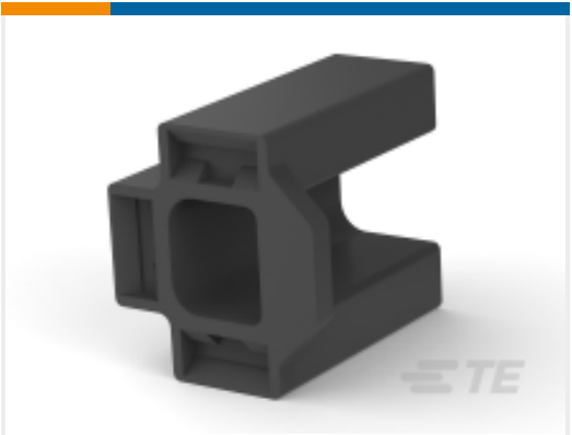
TE 产品编号 480100-1 FF 312 REC HSG 3P NYLON BLACK