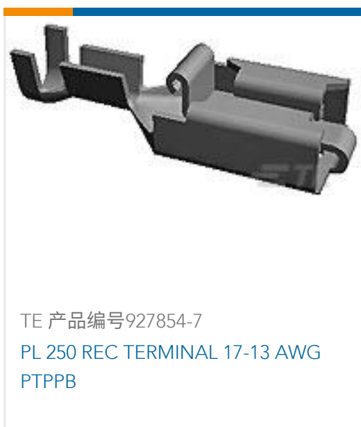
TE 产品编号927854-7 PL 250 REC TERMINAL 17-13 AWG PTPPB