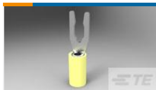
TE 产品编号52430-3 TERMINAL,PIDG SPR SPD 12-10 6