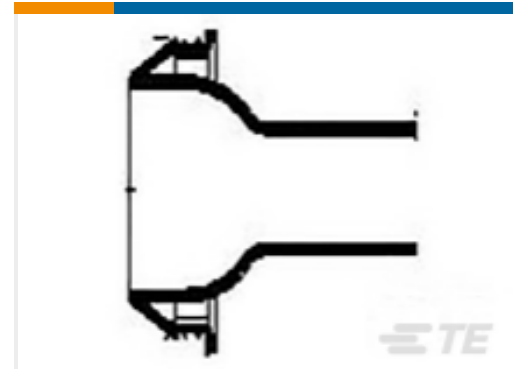
TE 产品编号984905-000 205A112-4/86-0