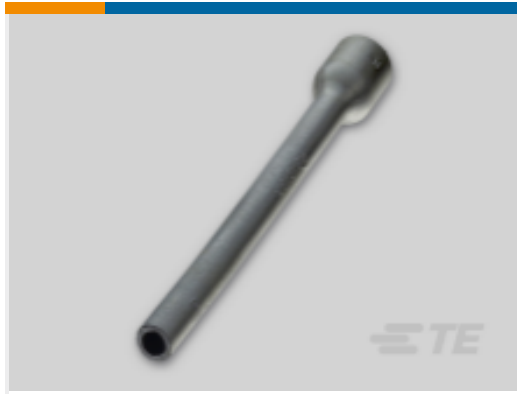
TE 产品编号D56121-000 202F242-770-0