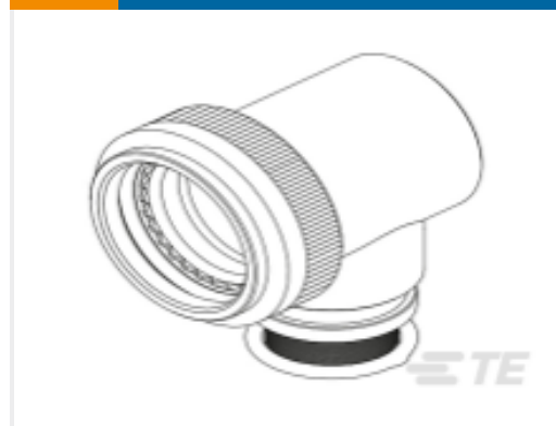
TE 产品编号CW5002-000 TXR21AZ90-1007AI