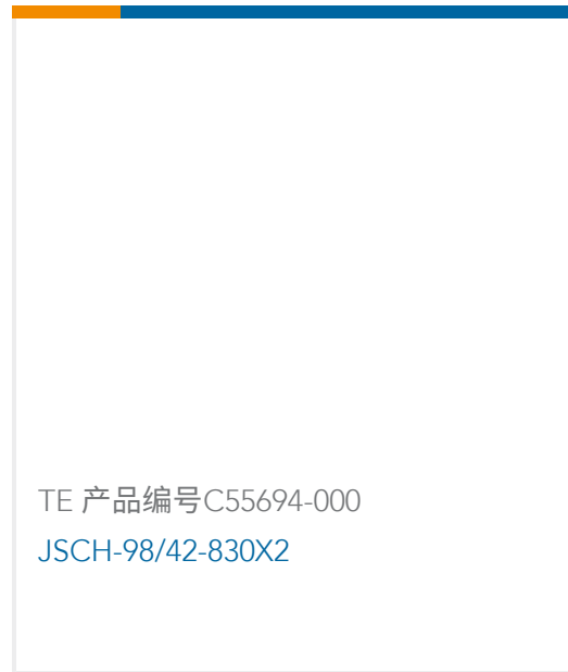
TE 产品编号C55694-000 JSCH-98/42-830X2