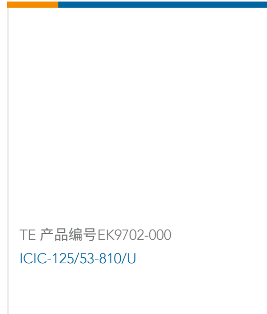
TE 产品编号EK9702-000 ICIC-125/53-810/U