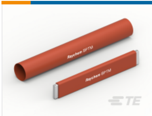
TE 产品编号407859-000 母线热缩管高达 24 kV