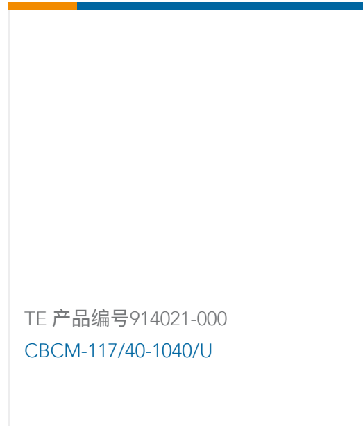
TE 产品编号914021-000 CBCM-117/40-1040/U