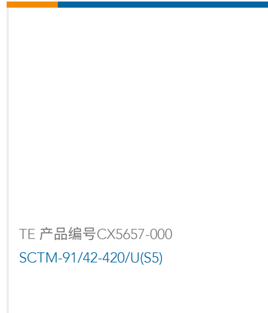
TE 产品编号CX5657-000 SCTM-91/42-420/U(S5)