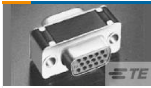
TE 产品编号212561-1 CONN SAVER,SZ 3,AMPLIMITE