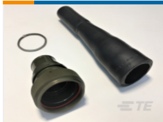
TE 产品编号743100-000 5420-00-230010