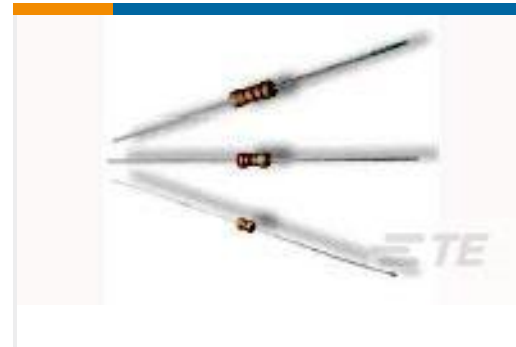
TE 产品编号1623933-5 CFR50 5% 33K