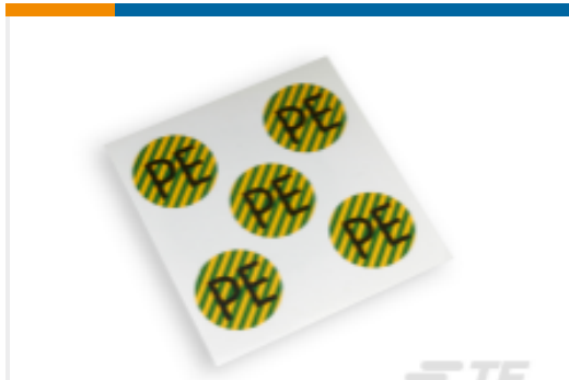
TE 产品编号571868-000 LKZ Vinyl Electric Symbol Labels