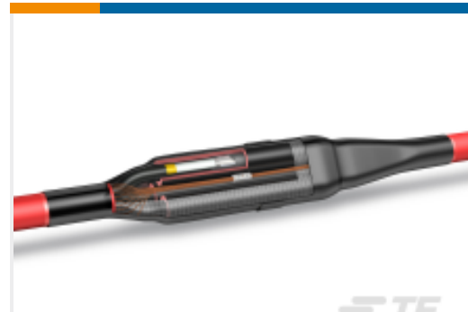
TE 产品编号CA6986-011 MXSU-3321