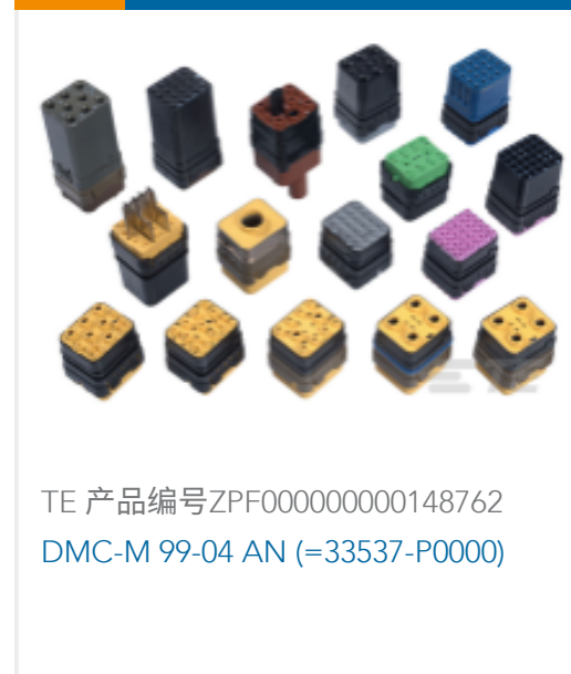
TE 产品编号ZPF000000000148762 DMC-M 99-04 AN (=33537-P0000)