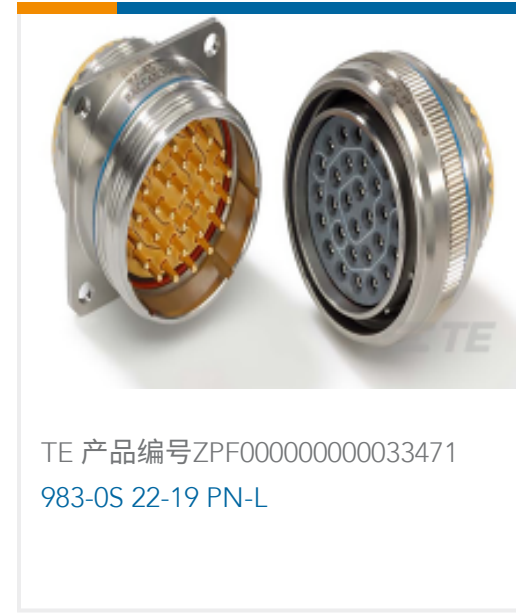
TE 产品编号ZPF00000000033471 983-0S 22-19 PN-L