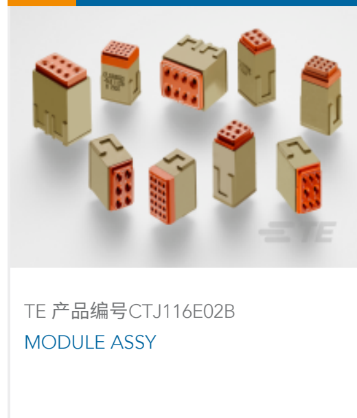
TE 产品编号CTJ116E02B MODULE ASSY