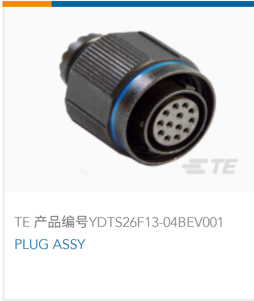
TE 产品编号YDTS26F13-04BEV001 PLUG ASSY