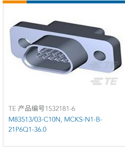
TE 产品编号1532181-6 M83513/03-C10N, MCKS-N1-B- 21P6Q1-36.0