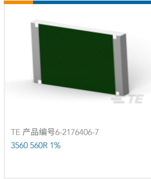
TE 产品编号6-2176406-7 3560 560R 1%