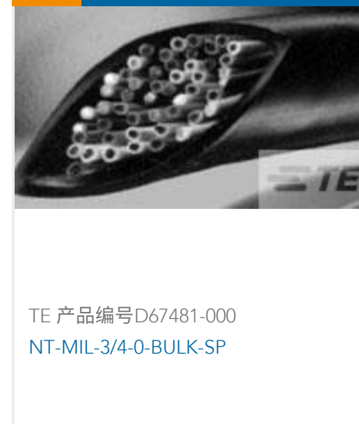
TE 产品编号D67481-000 NT-MIL-3/4-0-BULK-SP