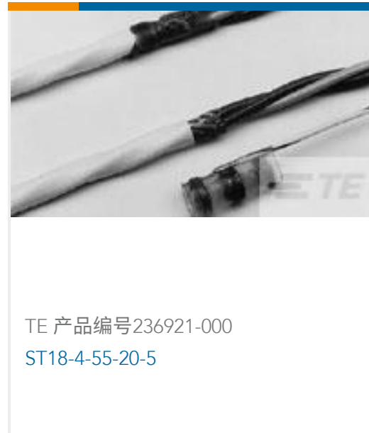
TE 产品编号236921-000 ST18-4-55-20-5