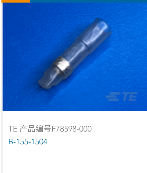
TE 产品编号F78598-000 B-155-1504