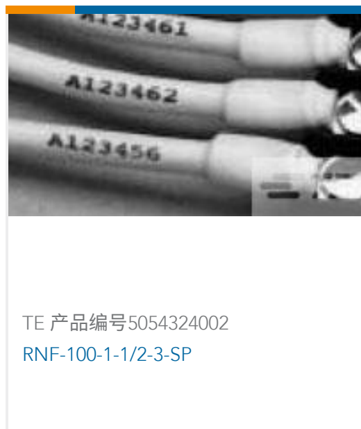
TE 产品编号5054324002 RNF-100-1-1/2-3-SP