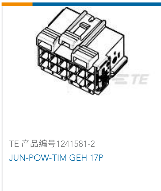
TE 产品编号1241581-2 JUN-POW-TIM GEH 17P