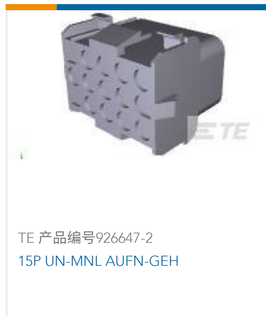
TE 产品编号926647-2 15P UN-MNL AUFN-GEH