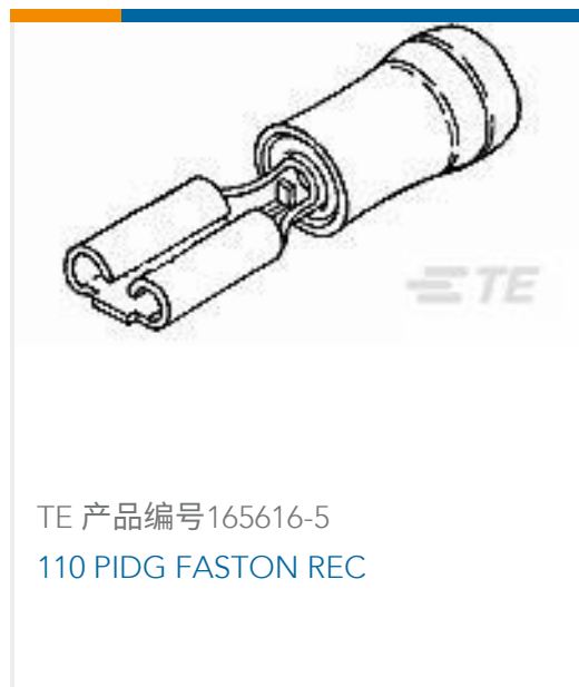
TE 产品编号165616-5 110 PIDG FASTON REC