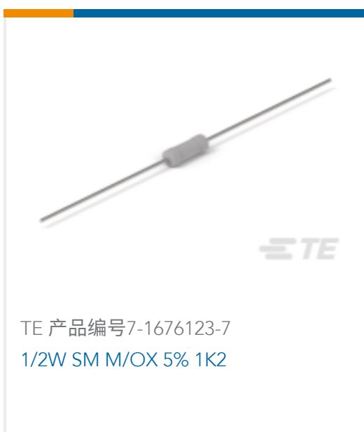
TE 产品编号7-1676123-7 1/2W SM M/OX 5% 1K2