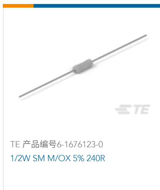
TE 产品编号6-1676123-0 1/2W SM M/OX 5% 240R