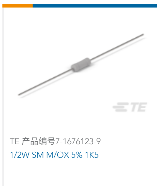
TE 产品编号7-1676123-9 1/2W SM M/OX 5% 1K5